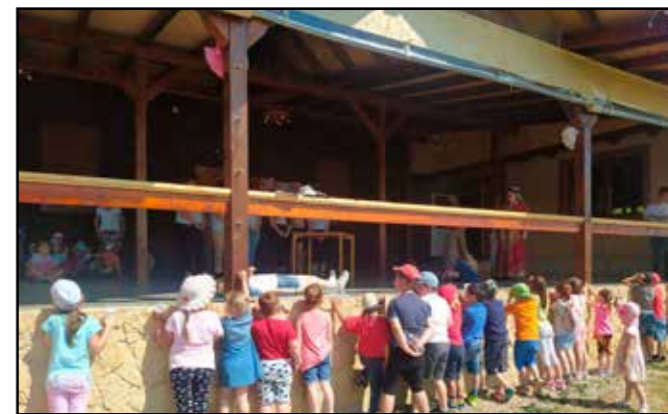
A kíváncsibb gyermekek a színpad széléről nézték az előadást

Az asztalnál ülők elmosolyodtak, megadták a kért cigarettát és az öt lejt.