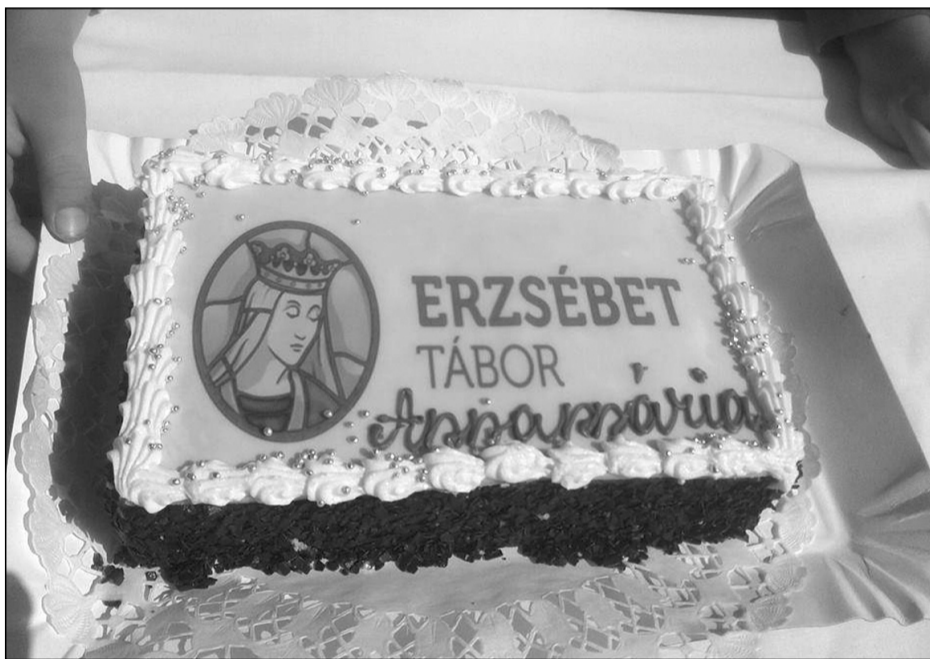
Sosem volt ekkora születésnap!