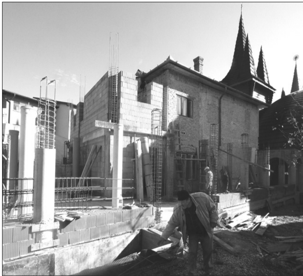
Két éven belül készülne el a törökvágási gyülekezeti ház

Folyamatos építkezés zajlik a Kolozsvári Református Egyházmegegyházközségeiben: Szászfenesen az els energiatakarékos templom munkálatai zajlanak, Törökvágáson a régi parókia épülete helyett gyülekezeti házat építenek, Magyarpalatkán gyülekezeti központ készül, a tóközi gyülekezet vezet i pedig egy húsz éve megálmodott id s otthon tervének kivitelezésén munkálkodnak. Az egyházi, állami támogatásból és pályázati pénzekb I zajló építkezések korántsem nyerték el még végs formájukat, a lelkészek lelkesedése viszont töretlen, és még a nehézkes ügyintézés sokszor végeláthatatlan útvesztet i sem riasztják el ket. A készülő épületek mindegyikének alapötlete közösségi igényre válaszul született: a frissen alakult vagy b vül gyülekezetek létez infrastruktúrája már nem felelt meg a szükségleteknek, korlátozott befogadóképessége, leromlott állaga vagy a felekezeti épület hiánya miatt nem bizonyult egyházi munkára alkalmasnak. (Részletek a 9. oldalon)