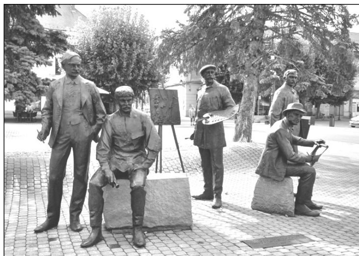
A festőiskola alapítóinak szoborcsoportja