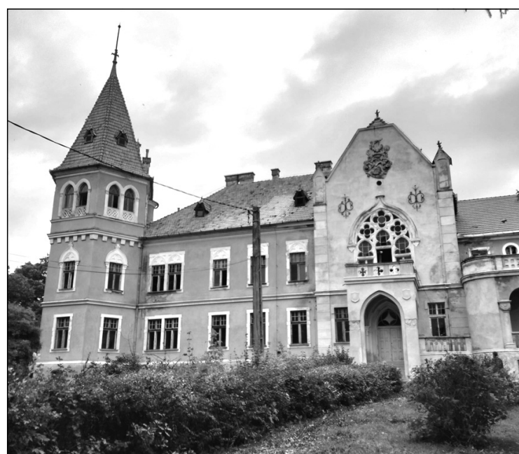
A mezőzáhi Ugron-kastély

vele. A másik legenda is hasonló, csak hogy ezúttal az orosz cárlányáról szól a love story. Akárhogy is volt, az biztos, hogy sohasem házasodott meg, magányosan élte le életét, kastélyát a testvére unokájára hagyta, akit örökre fogadott. Idegenvezetőnk mesélt a birtok és a család történetéről, Ugron István lenyűgöző életéről és pályafutásáról, a kastély építésének történetéről, a berendezéséről a korabeli leltár alapján és egyéb érdekességekről. Megcsodálhattuk az épület külső díszítését, majd a szobákba lépve az ismeretelés alapján elképzelhettük, hogy milyen lehetett itt az élet 100 évvel ezelőtt, és láthattuk, hogy mennyire tönkre lehet tenni egy gyönyörű kastélyt. Államosítás után a mezőzáhi Ugron-kastélyból a berendezési tárgyak legjavát hivatalos személyek hordták szét. A kastélyban 1954-ig gabonagyűjtő központ, 1954–1959 között iskola és 1959–1962 között gazdasági líceum működött. Az épületben 1963 óta gyerekközpont működött, amelyet 2012 júliusában számoltak fel. Azóta elhagyatottan áll és napról napra pusztul. Sajnos a család, bár próbálkozott, nem tudta visszaszerezni,