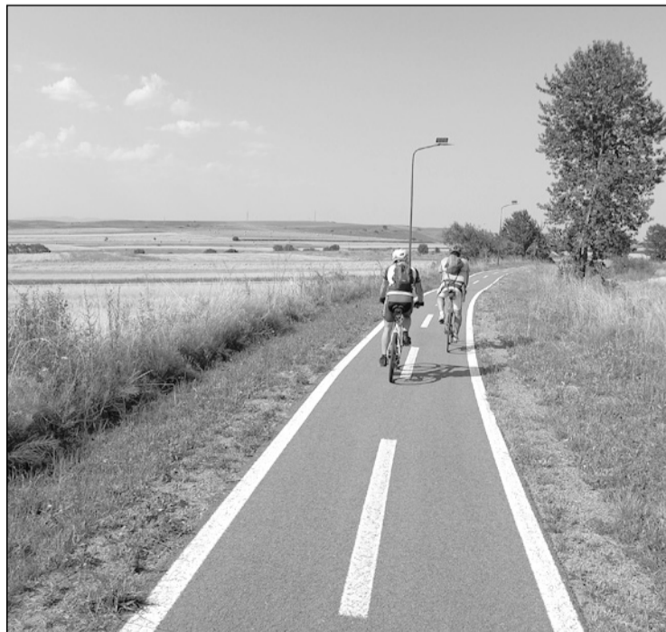
A kalotaszentkirályi bicikliút

Kétségtelen, számomra ez volt az eddigi legvagányabb, legvidámabb, legkalandosabb és az extrém hőmérséklet miatt a legnehezebb Vasvári. Köszönöm szépen a szervezőknek!