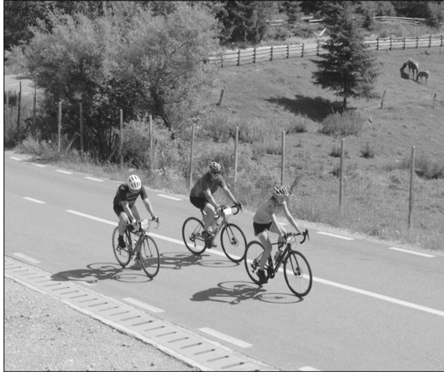
A meleg és az emelkedő sem szeghette a résztvevők jó kedvét

A Meleg-Szamos völgyén felfelé haladva olyan kellemes hűvös levegő fogadta a bringásokat, hogy szinte fáztak, ám amikor maguk mögött hagyták a fák oltalmazó árnyékát, egyre izasztóbbá vált a helyzet. A leggyorsabb bringás annyira meg szeretne volna