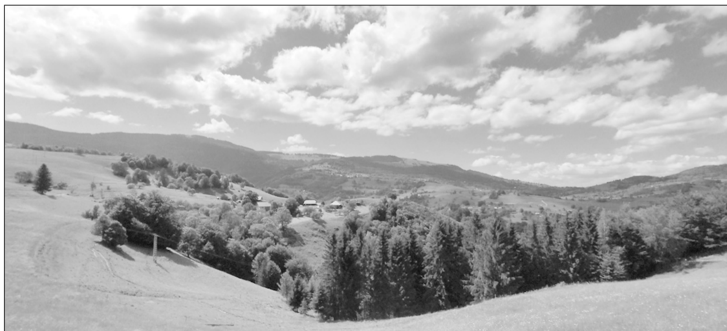
Mindig szívderítő megfigyelni Havasrogoz hegyi kaszálók között megbújó házait, kertjeit

A túra végén némi izgalommal vegyes méltatlankodással gondoltam arra, hogy bizony, a patak fölött nincs híd (ami van, az messze van), és