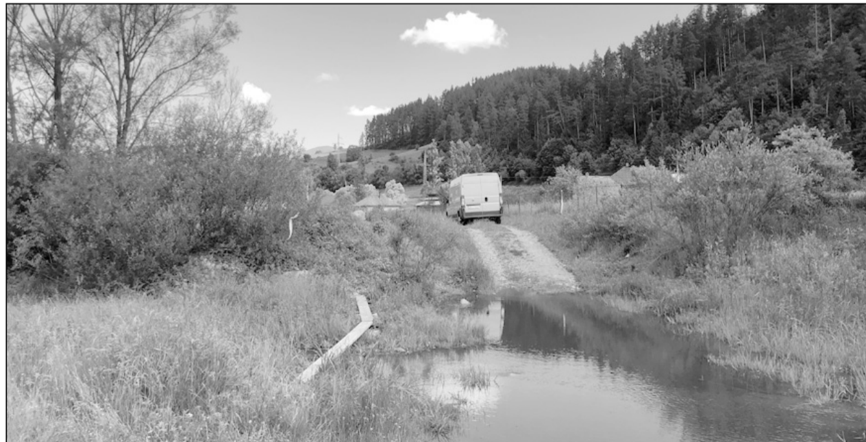
Spontán pallóépítés a Székelyjő patak mellett kialakult kis tónál