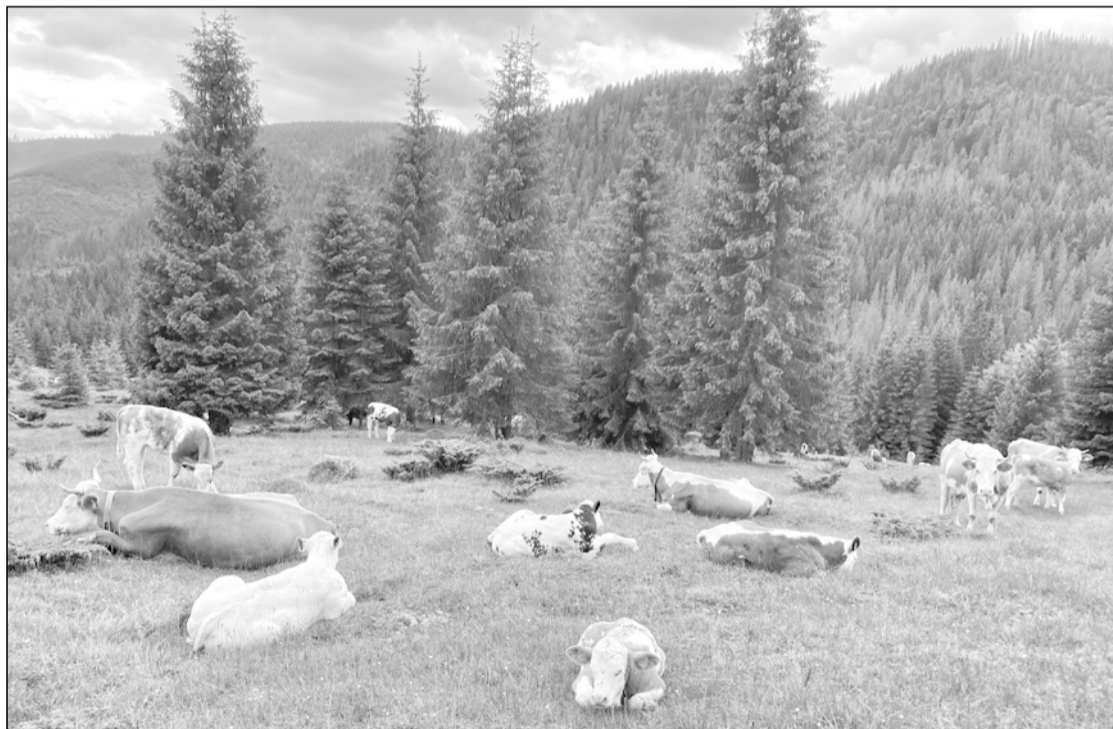
A fenyvesből kibukkanó csorda látványa mindenkit meglepett

tük, beszélgettünk, és a kidőlt fáknek köszönhetően többször szemügyre vehettük a szomszédos hegyvonulatokat. Egyik barátunk annyira szemfüles volt, hogy az út menti erdőben rókagombát is talált!