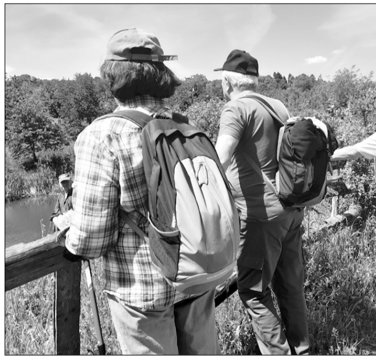
Szucság felső végén a kis tónál