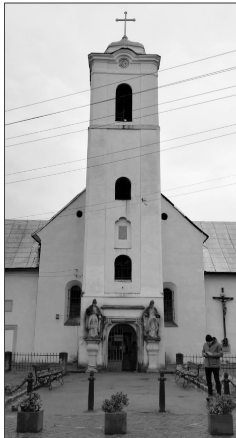
Salamon-templom, az első örmény kőtemplom a városban

Mi mással is fejezhetjük volna be az örmény metropoliszban tett kirándulásunkat, mint hagyományos örmény étellel, ángádsáburtt, amaz hurutos levest fogyasztottunk az egyik helyi vendéglőben. Bár a kirándulást karácsony előtt néhány nappal szerveztük, mégis szép számban, 43-an összegyűltünk, emellett három dési EKE-tag is csatlakozott hozzánk.