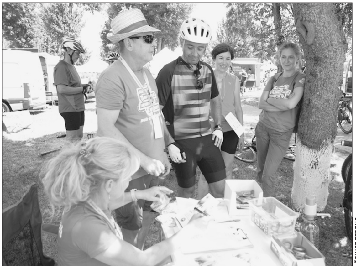
A Vasvári kerékpáros teljesítménytúrára az első hamarabb célba értek, mint a pontbírók

• Mint pontozó bíró, felejthetetlen élmény, amikor a gyerekeket háton hordozva beérkeznek a célba a családok.