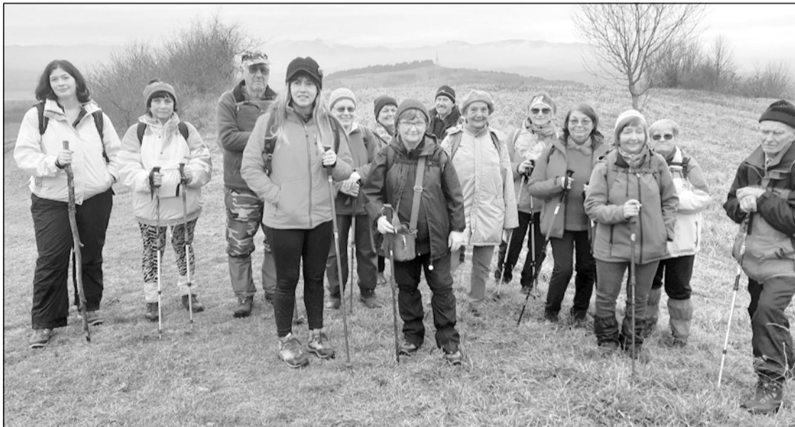
Késő ősz a szászfenesi erdőben

Reméljük, hogy az új esztendő sok szép kirándulást és kellemes napokat hoz majd minden természet szerető és természetjáró embernek.