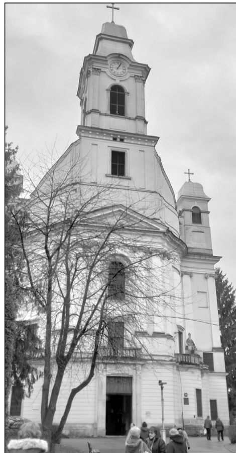
Az örmény katolikus székesegyház