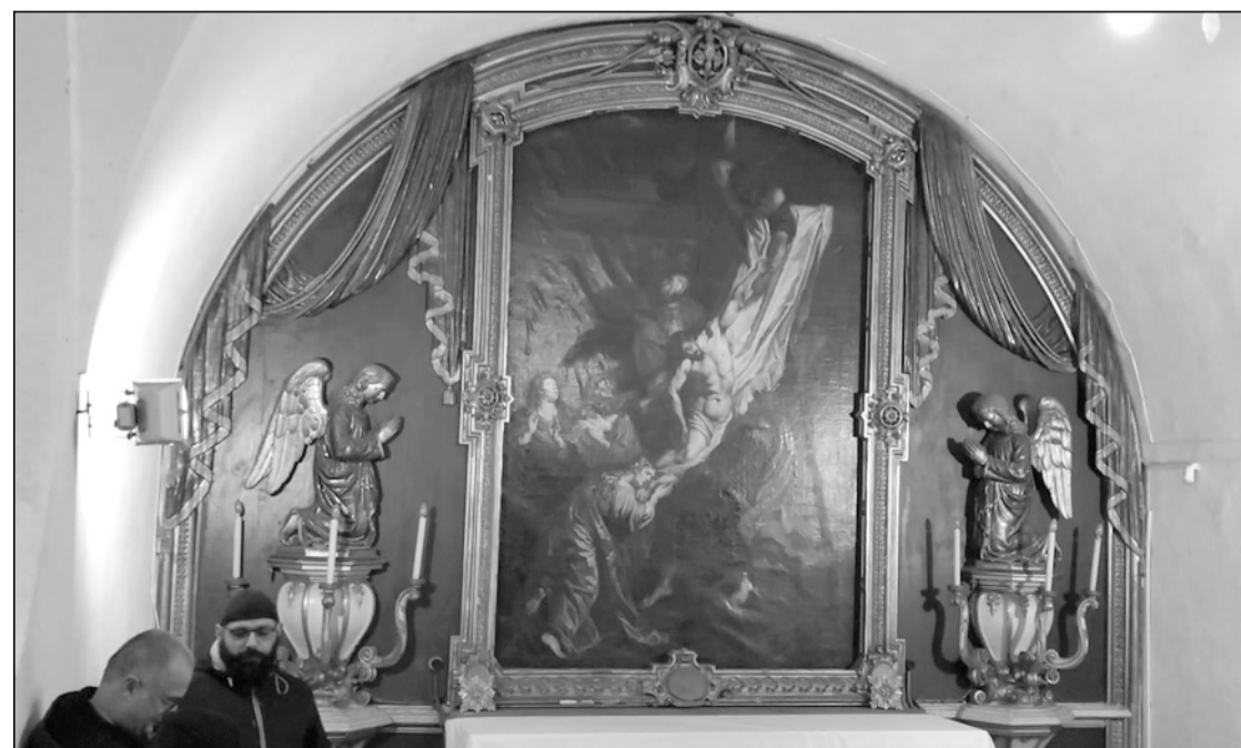
Krisztus levétele a keresztről – Joachim von Sandrart műve

Örményország volt a világ első országa, ahol 301-ben lett államvallássá a keresztény-