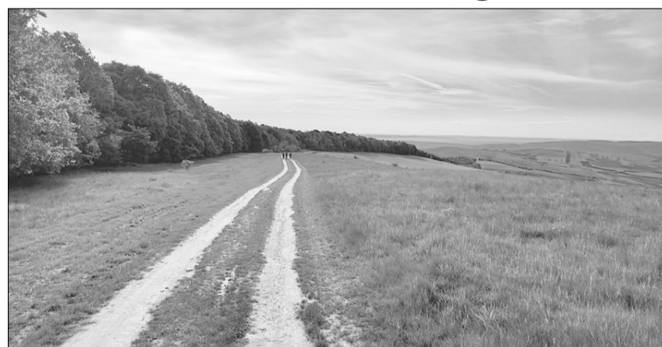
A Mikes-gerinc szakasza nagyon kellemes volt enyhén lejtő terepével

Az Adrenalin Parknál lévő ellenőrzőpontig bemelegedtünk, s ez idő alatt kielőztek bennünket a terminátorok, vagyis azok a sportolók, akik futva indultak el a hosszú útra. Egy nap majd mi is terminátorok leszünk. A Mikes-gerinc szakasza nagyon kellemes volt enyhén lejtő terepével, rengeteg pocsolyájával, és ébredező, kakukkszóval hangos erdejével. Az erdőből kiérve láttunk egy gyönyörű özet, ahogy végigrohant a domboldalon az erdő irányába. Általában az özeteket nem lehet huzamosabb ideig megfigyelni, hiszen a fák között néhány másodperc alatt nyomuk vész, de ennek