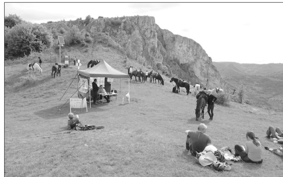
A tizennégy lovas résztvevő a Székelykő nyergét is érintette

Akárcsak tavaly, ez alkalommal is csatlakoztak lovasok a Jókai-teljesít-