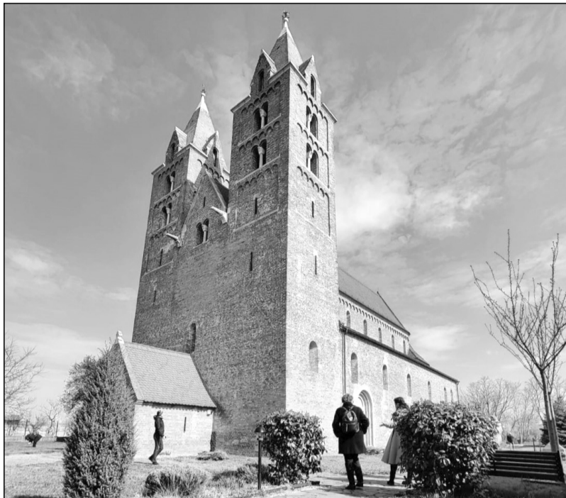
A különleges Árpád-kori ákos református templom

Ezután a nagykárolyi Károlyi-kastély következett. Mivel ez az épület eléggé ismert a köztudatban, úgy érzem, itt szinte feleslegesek a szavak. A kastély megláto-