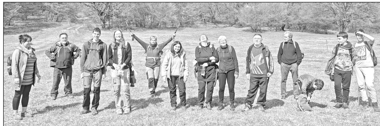
A vidám társaságot teljesen megpendítette a tavasz

Türében megálltunk egy hűsítőre, kávéra és fagyira, megbeszéljük a nap élményeit, s egyetértettünk abban, hogy jöhet a következő. Magyargorbótól vonatópótló busszal jutott haza az immár sokkal csendesebb, bágyadtabb csapat.