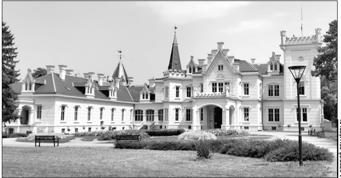
A gyönyörűen felújított Nadasdy-kastély Nádassdladányban

rű operettkomponista. Egykori szülőháza ma emlékházként működik. A szülőház földszinti termeiben megtekinthető kiállítás bemutatja Kálmán Imrét, az embert, pályafutásának fontosabb állomásait és magánéletének érdekesebb történeteit. A kiállítás anyaga kiter a Bécsben, Amerikában, Párizsban töltött éveire is, érzékeltetve, hogy a zeneszerző a sikeres