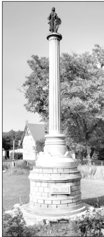
Az 1896-ban felavatott millenniumi emlékoszlopok többméteres makettjeinek egyike (Brassó, Cenk)

Utunk következő állomása a Somogy vármegyei Siófok, a Balaton déli partjának fővárosa. Itt született 1882-ben Kálmán Imre, a világhí-