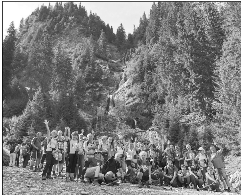
Csoportkép a Lóhavasi-vízesés előtt