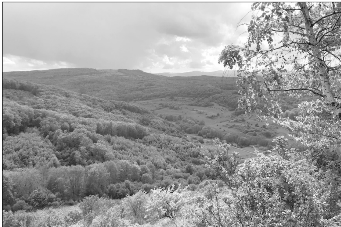
A Brüll-kilátóról a Gorbó völgyét, a Gorbó-gerincet, a Havas-bükkét, a távolban pedig a Gyalui-havasokat is megcsodálhatjuk

A rét szélén, a kivágott rönkökön, árnyékos, kényelmes ebédülőhelyet találtunk, de házáig még hosszú út várt ránk. A Dumbrava-gerincen, a kék kereszt jelzés tovább folytatódik és csatlakozik hozzá a piros háromszög is, amely adott pillanatban letér balra a Slamovics-ház tisztása felé. Rövid pihenő után tovább indultunk egy másik kedvelt, régi emlékeket felidéző tisztásra, a Brüll-kilátóra, ahonnan szép kilátás nyílik a Gorbó-patak völgyére és szemben velünk a Gorbó-gerincre. Ezek után még egy kedvelt hely maradt hátra, amit nem lehetett kihagyni, a Cérna-forrás tisztása. Ennél a forrásnál, bármilyen vékonyan csordogált is a vize, mindig fel tudtuk frissíteni a maradék ivóvizünket. Most is szükség lett volna rá a hosszú és meleg nap után, de a forrás cserbenhagyott, mert vize alig csepegett a hosszan tartó meleg és szárazság miatt. Alig tudtunk fogni fél pohár vizet.