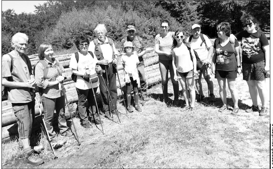
Csoportkép a Bivalyoson

Ebédszünetet tartottunk és megbeszéltük a hazamenetelt, egy rövidebb és egy hosszabb változatot. Akik a rövidebb megoldást választják, a fehér békával jelzett tanösvényen lemennek a Sunny Hill szállóig, a szelicsei útra, a távolság a Majláth-kúttól körülbelül 1 km, onnan a 46L autóbussz órarend szerint közlekedik és a Hajnal negyeden keresztül lemegy a városba. Akik a hosszabb utat választják, tovább mennek a Sáros-bükk felé, majd a Péter úton és a Dióson keresztül leereszkednek a Monostor lakónegyedbe, ez még 6 km gyaloglást jelent. Kétfelé vált a csoport, mindenki ment az általa választott úton. Akkor még nem látszott, hogy változik az idő, így a Péter úton alaposan eláztatott egy kiadós nyári zápor, amely kisebb jégesővel is társult.