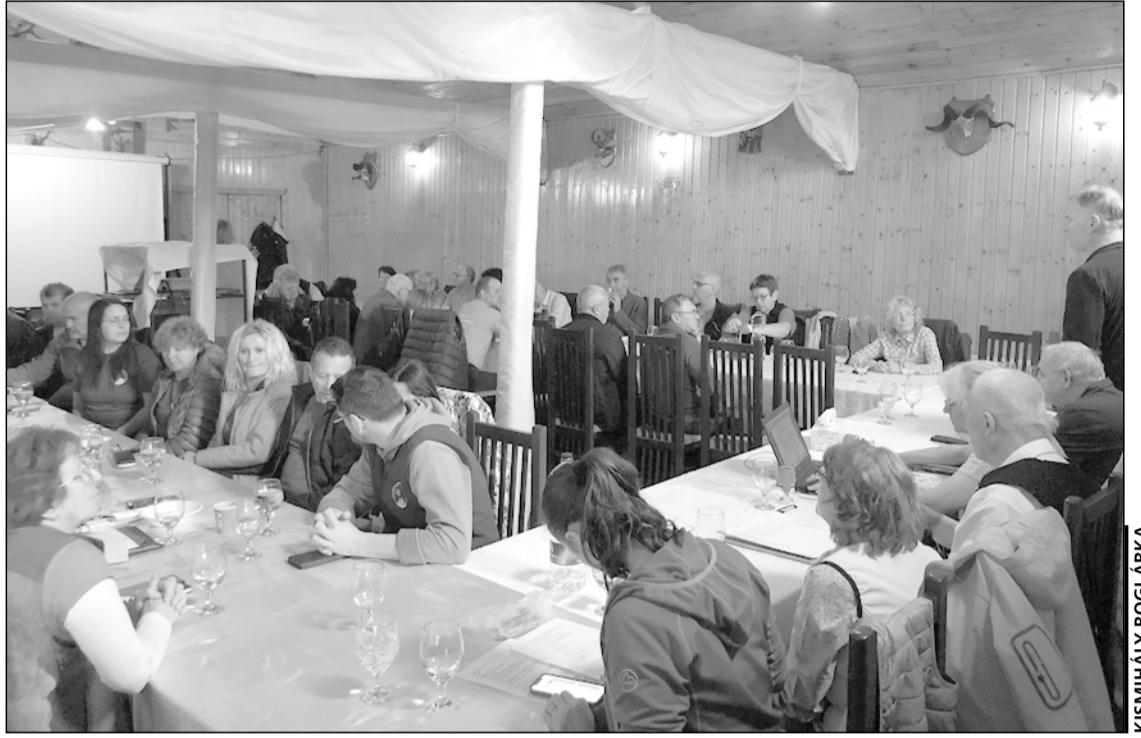
A múlt hétfői EKE-közgyűlésen 18 tagszervezet 54 küldöttje vett részt

A Csíkszéki EKE-ben jó az egyesületi élet, saját néptáncgyűttesük van 15 párral, sikeres pályázat segítségével működik a folkapp.ro, ame-