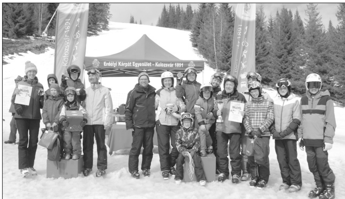
A legnépesebb résztvevő családnak járó vándorkupát idén a 11 tagú A piszkos tizenkettő csapat vihette haza

Időeredmények és további helyezések a családi. ekekolozsvar.ro oldalon.