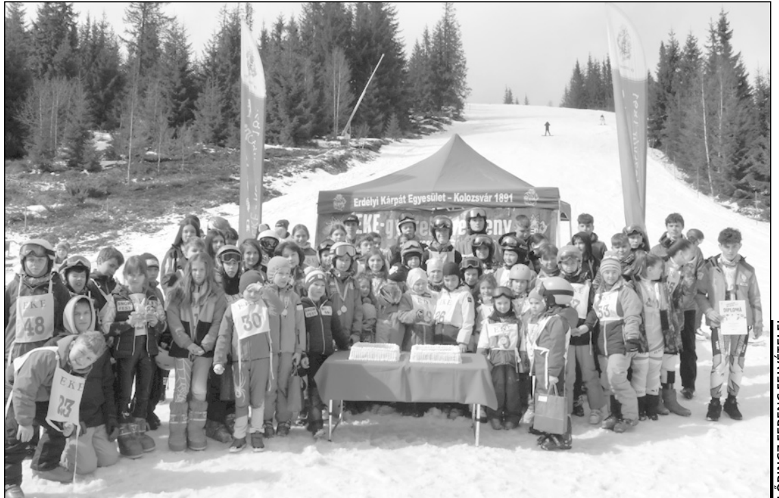
Születnapi tortás csoportkép a 80 résztvevős XX. EKE-gyereksíversenyen

A díjazás után a gyerekek nagy-nagy örömeire tombolással és a várva várt meglepetés, egy 20 éves jubileumi gyü-