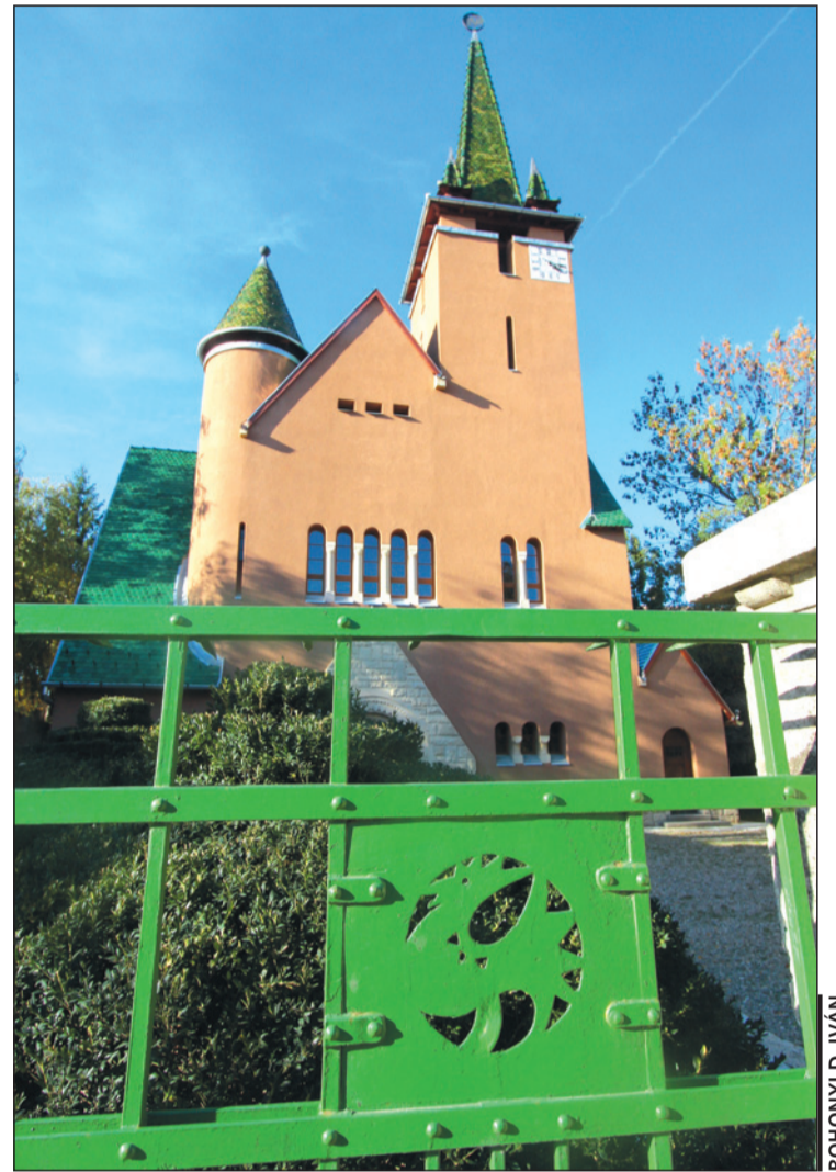
A kolozsmonostori református gyülekezet 359 éve alakult

A centenáriumi évfordulót a csodálatos templom megújulva várta. A '70-es években is történetek helyreállítási munkálatok még Kós Károly közvetlen felügyeletével, az utóbbi években megerősítették a tetőszerkezetet, a tetőzet eternitlapjait Zsolnay-cserepekre cserélték, a régi nyílászárókat jó hőszigetelést biztosítókat váltották fel, megújult a padlózat, villanyhálózat és a festés kívül-belül, valamint az udvar. A kétnapos ünnepség során bemutatták Szigeti László presbiter A Kolozsvár-Felsővárosi Egyházközség története , illetve dr. Molnár Dezső egykori lelképásztor visszaemlékezéseit tartalmazó, Mintha repülnék című köteteket. Emléktáblát lepleztek le a templom mögötti, egykori református elemi iskolának 1931–1948 közötti helyet