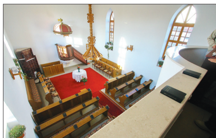
Szamosfalva első református temploma 1530-ban épült