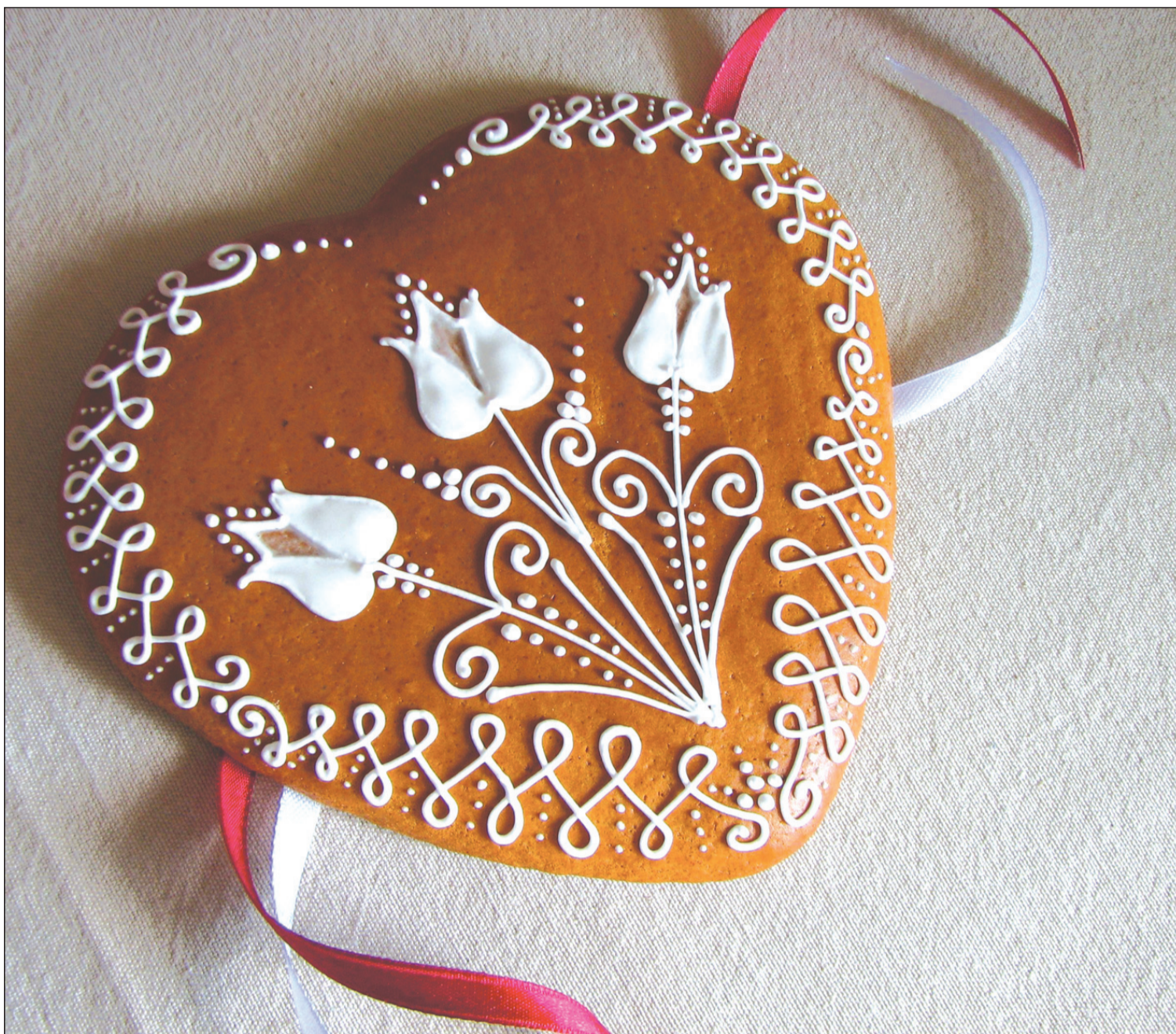
A szervátültetés Isten ajándéka – legyen önkéntes és ingyenes

Meg kell említenünk azonban egy eltérő jelenséget is, ami-