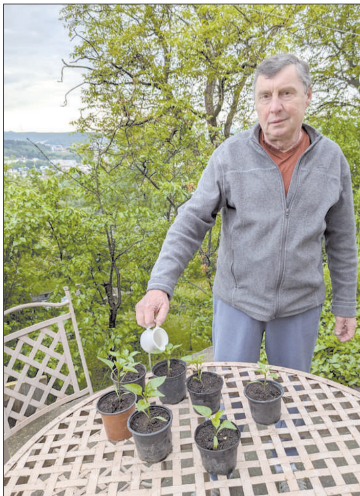
Örömmel tölt el az Úrnak munkatársa lenni