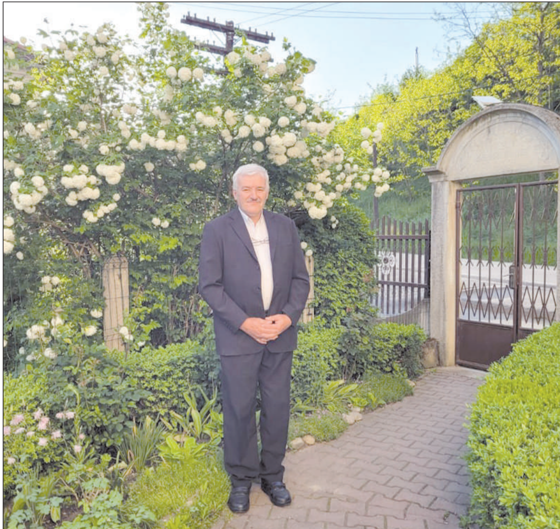
Hítvallásom meghallgatni mindenkit, aki hozzám szól, gyerektől, fiataltól, időstől is tanulhatok

– Az egyetemes imahéten szokás, hogy meghívott lelkészek prédikálnak, és az istentiszteleten elhangzó zsoltárokat a gyülekezet választja ki. Egy-egy ilyen istentisztelet nagyon tanulságos lehet a fiatal kántoroknak, és arra készíteti őket, hogy legyenek felkészülve minden eshetőségre. Azt tudom ajánlani, hogy szeressék ezt a hivatást. Szeressék a híveket ott, ahova elrendeli Isten, hogy szolgáljanak. Legyenek hűek és alázatosak a velük szolgáló lelkipásztorokhoz. Legyenek hűek a magyar református egyházhoz. De a legfontosabb: legyenek hűek Istenhez és az Ő egyszülött fiához, az Úr Jézus Krisztushoz, dicsőítsék Krisztust énekekben és cselekedetben. Azt kívánom a fiatal kántoroknak, hogy szeresse őket a gyülekezet.