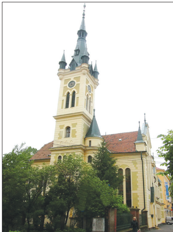
A hidelvei egyházközség temploma a XIX. század végén épült

– A legfontosabb, hogy az emberek megértsék Isten üzenetét. Sok esetben megtörünk a különböző terhek alatt, és hajlamosak vagyunk rossz megoldásokat választani, de soha nem szabad elfelejtenünk, hogy mindig van egy csodálatos megoldás, a lelki felszabadulás Krisztusban. Ez biztos módja annak, hogy a sötétből kijussunk a fényre, a tehetetlenségből a minden jó lehetőségek tág terére.