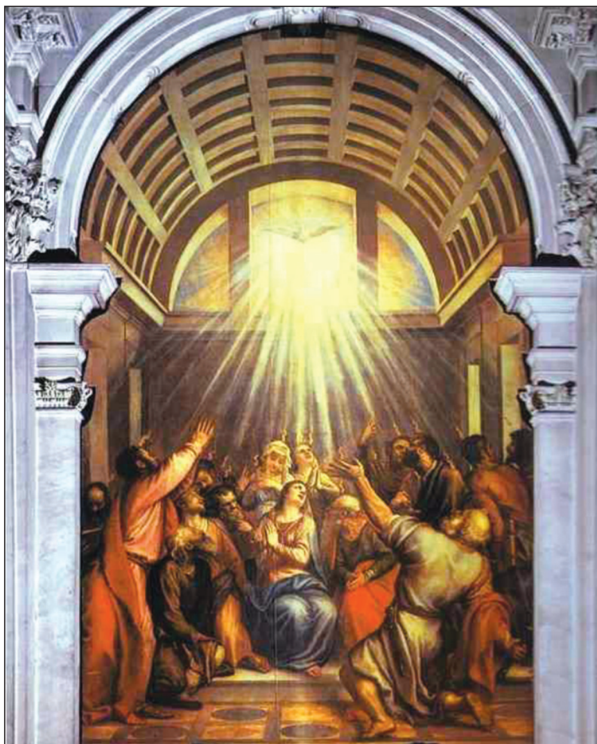
Tiziano: A Szentlélek eljövetele (1545)

Egyházközségeinket a lelképásztorok vezetik a presbitériumokkal szoros együttműködésben. A lelkész elsőrendű feladata Isten igéjének hirdetése. Ezt a feladatát csak akkor végezheti megfelelő szinten, ha nem kell a közösség egyéb, sokrétű problémáival foglalkoznia. A presbiter feladata tehát, hogy ezen egyéb ügyekkel – mint az adminisztráció, közösség-építő-szervező munka, vagyonkezelés, az istentiszteleti rend és fegyelem biztosítása – foglalkozzék. A presbiter tulajdonképpen nem a lelkészért tevékenykedik, hanem segíti őt és a gyülekezetet, s így együtt Krisztus egyházát építik.