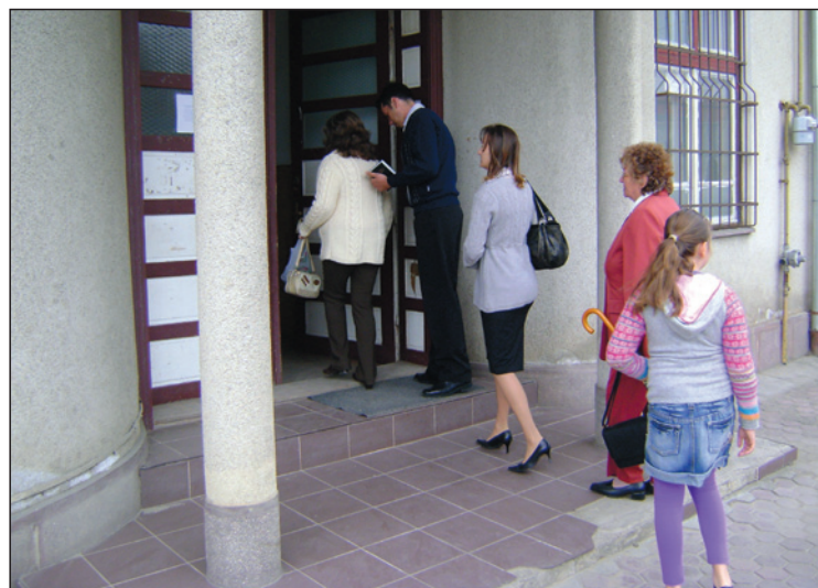
Istentiszteletre igyekeznek a szászfenesi hívek

Szászfenesen a kultúrházban tartják az istentiszteleteket, és egy tömbházlakás az egyetlen ingatlan, amit magukénak tekinthetnek a reformátusok.