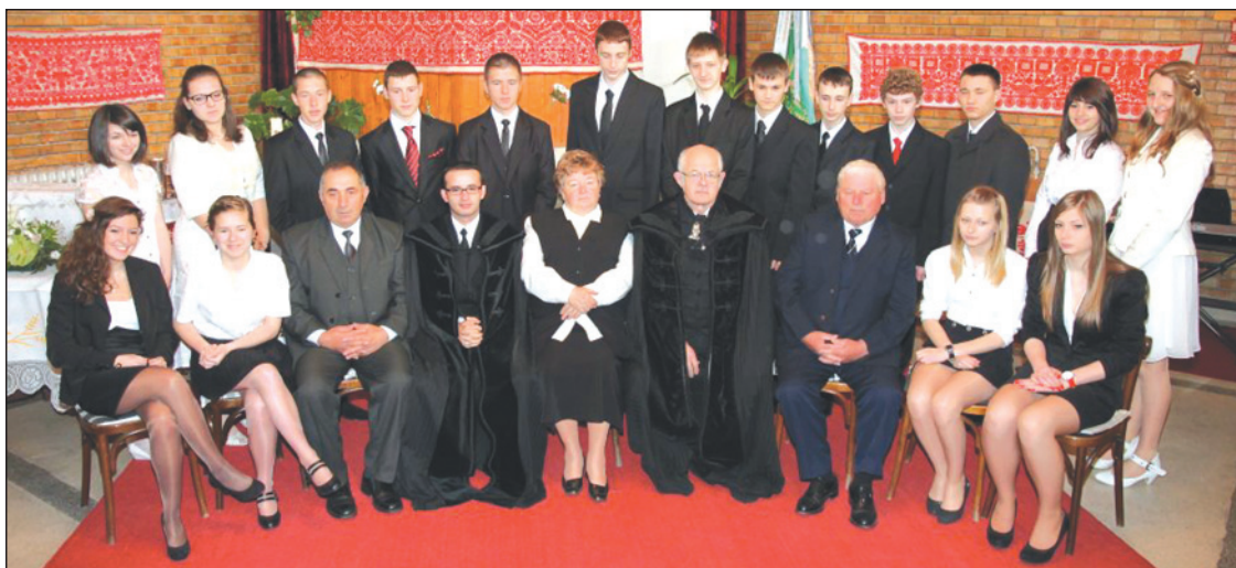
A Kerekdombon 17 fiatal – 9 fiú és 8 lány – konfirmált 2012. április 15-én. A kerekdombi reformátusok IFI zenekara kis ünnepi műsorral köszöntötte őket.