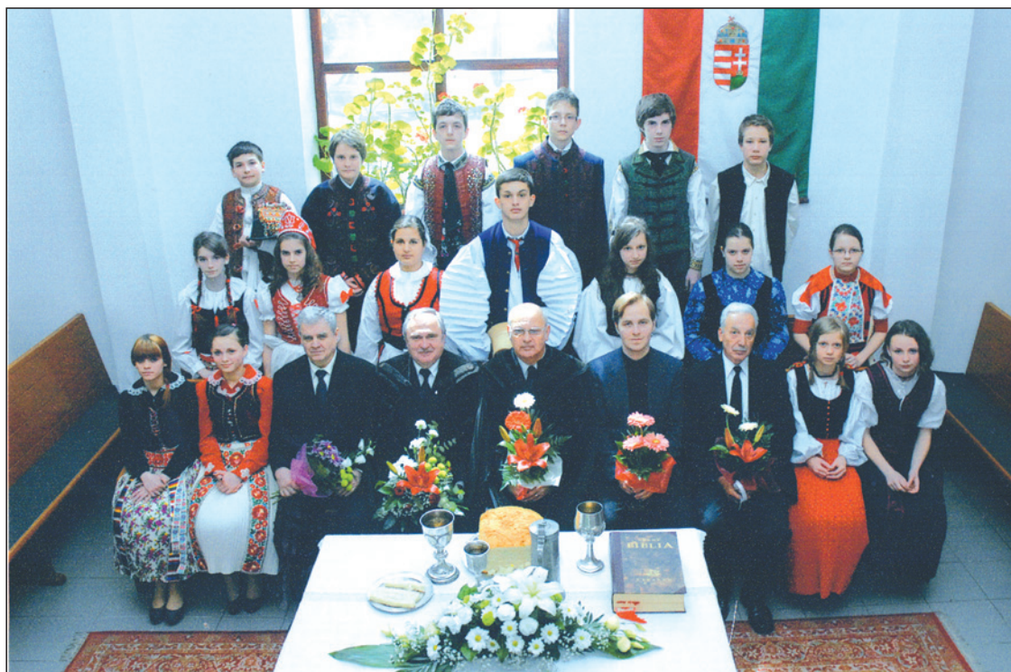
Konfirmáció a Pata utcai Fehér templomban 2012. április 22-én, konfirmált 10 lány és 7 fiú.