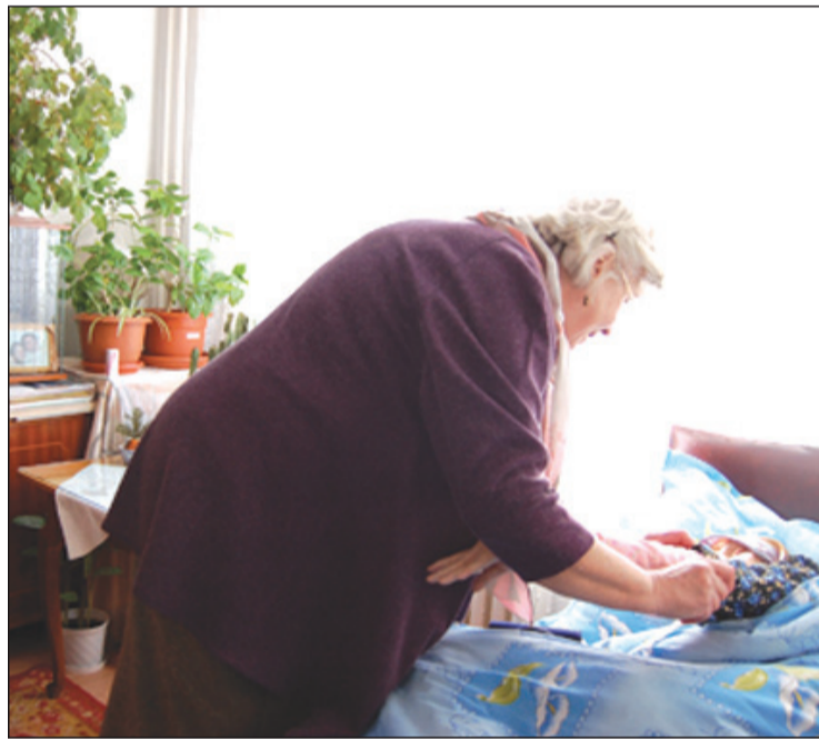
„Gondoskodással tartozom a sok jóért, amit életemben kaptam”

– Igényeltek már injekciót, medencecsonttörés miatt nehezen mozgó személy esetében tanácsadást. Fordult hozzám már kétségbeesett férj felesége súlyos állapota miatt, máskor egy autóbaleset áldozata hosszadalmas utógondozást igényel. Előfordult kérés,