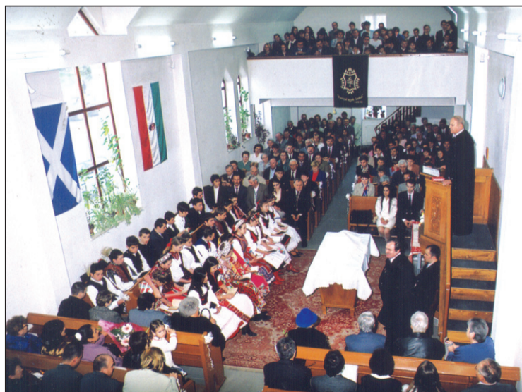
Konfirmálásakor megtelik a templom népviseletbe öltözött ifjakkal

– Visszatekintve nyugodt lélekkel el tudom mondani, hogy kudarcaim sosem voltak. Mindig tudtam, mit lehet megvalósítani: álmodtam, de nem álmodoztam. Sok mindent sikerült elérnem, e mögött azonban mindig ott állt a családom. Ha megkérdezték tőlem, mi a sorrend az életemben, azt feleltem: első a gyülekezet, aztán megint a gyülekezet, aztán a család. Megértő családom van, akik sosem sérelmezték, hogy esetleg karácsonykor várniuk kellett, hogy együtt tudjunk asztalhoz ülni, ezt azonban most kárpótólják a vasárnapok, amikor együtt lehetünk mindannyian. Jutalomként éltem meg, hogy ilyen családom és ilyen gyülekezetem lehetett, ez mindig erőt adott. Hiszem, hogy a gyülekezet és a munkatársaim ezentúl is mellettem lesznek, együtt sok mindent megvalósítunk, mindezt pedig egyedül Istennel és Istené, hiszen mind ez ideig megsegített, és hiszem: Ő tudja, mi az, amire szükségünk van.