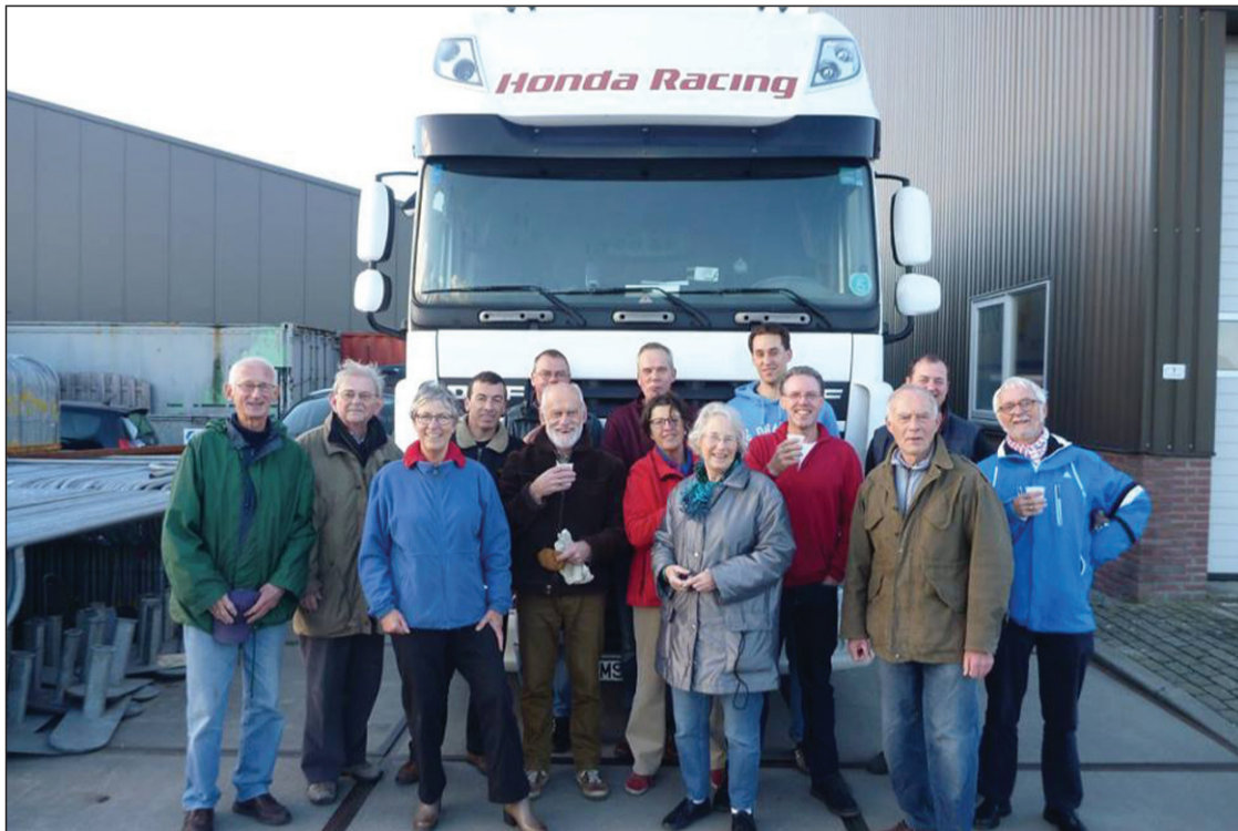
Indul a szállítmány a Kerekdombra

Két évtizede segíti a kerekdombi gyülekezetet a hollandiai kapcsolat