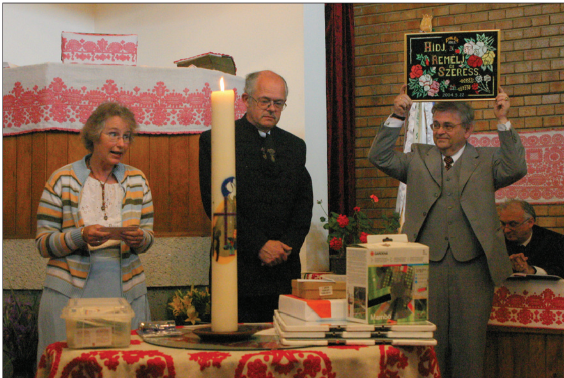
A bogártelki Filemon ház avatásának ünneplése a templomban