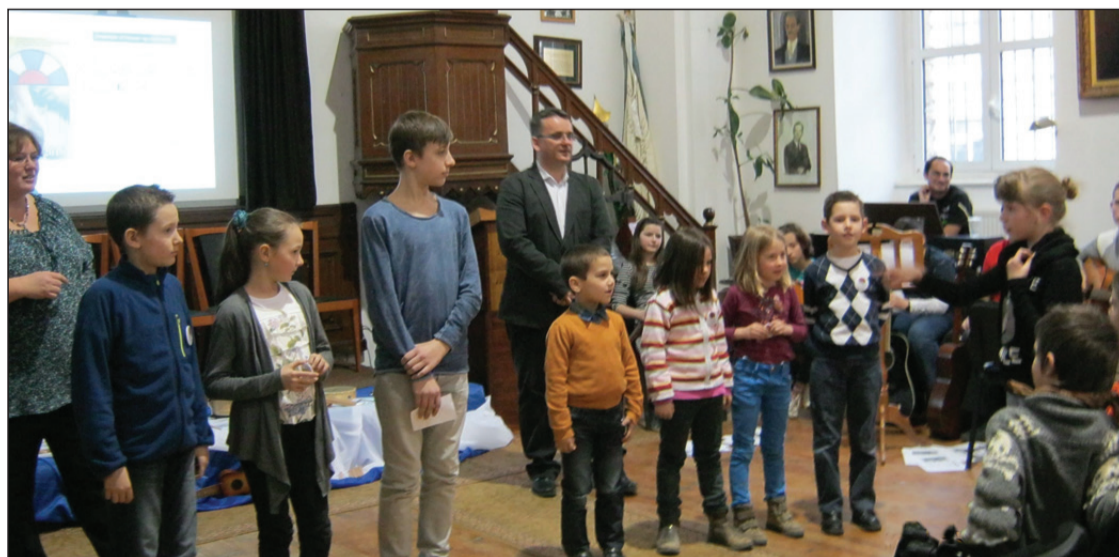
Kuba is téma volt