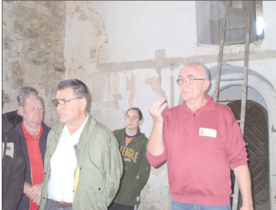
Templomtakarításon Magyarderzsén 2014-ben

– Kevéssel a rendszerváltás után lettem presbíter részben azért, mert felkérték rá, másrészt úgy éreztem: erre az Úristen kér fel. Nagyon szívesen vállaltam a megbízatást. Presbíterként mindig az egyházközség érdekeit helyeztem előtérbe, a lelképásztorral együtt a gyülekezet lelki életéért, anyagi-gazdasági helyzetéért, a templom és más ingatlanok állapo-