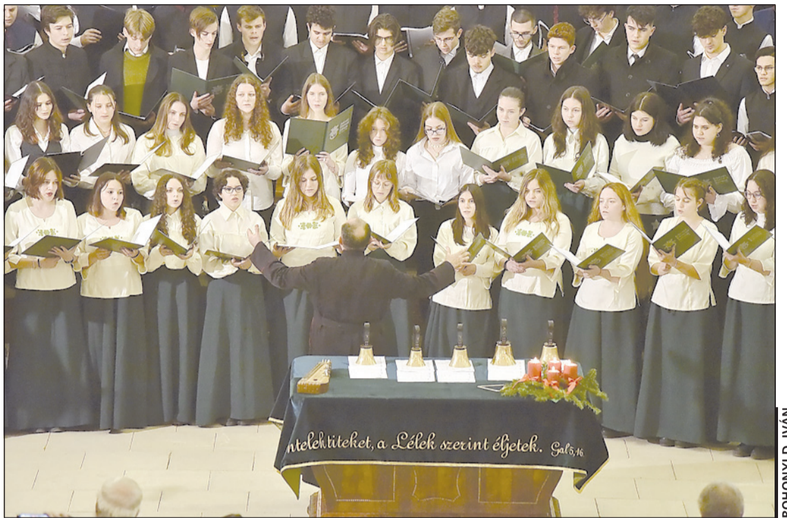
Volt idő, amikor senki nem akarta, hogy a két felekezet iskolája együtt készüljön az ünnepre

Minek köszönhető mégis, hogy 2023-ban harmincadik alkalommal szolgálunk együtt, hirdetve a jó hírt? 1993 adventjében a Brassai-líceum akkori igazgatója nyújtott segítséget: „Gyertek hozzánk, ott a dísztermünk, tartsátok meg ott a koncertet.” Így indult útjára a próbálkozás, amelyről akkor igen sokan azt hitték, holtan szüle-