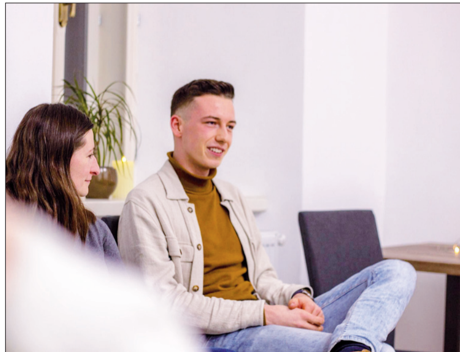
A jövő év legnagyobb kihívása az augusztusi Válts irányít! IKE Fesztivál Zeteváralján

– Nagy öröm és áldás az Erdélyi IKE számára, hogy a belvárosba, a Herepei-házba költözhetünk, fontos mérföldkő az Erdélyi IKE 1921-es alapítása óta, hogy olyan helyen működhetünk, amelyet nem csupán irodaként, hanem ifjúsági központként használhatunk. Időre van szükség ahhoz, hogy az épület valóban ifjúsági központként működjön, hogy az önkéntesek és a rendezvények résztvevői megszokják és megismerjék a helyszínt, ebben a FIKE (Főiskolás Ifjúsági Keresztény Egyesület) rendszeres eseményei sokat segítenek. December elején, az önkéntesek világnapján közösen karácsonyoztunk, máskor adventkoszorú-készítést hirdet-