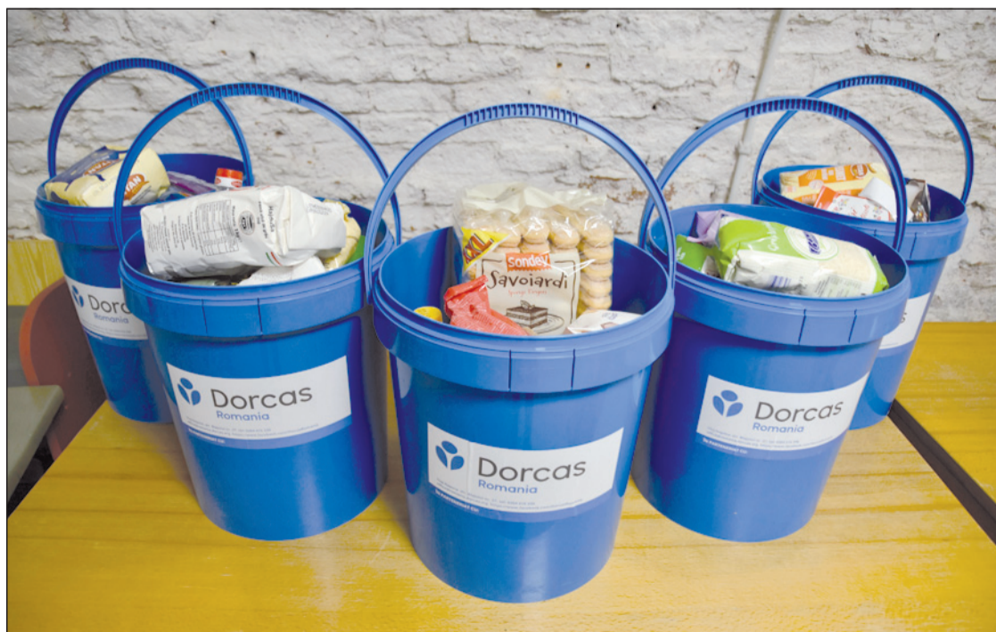
Mintegy 80 vedret sikerült tartós élelmiszerekkel, édességekkel megtölteni

A generációkon és kontinenseken átívelő projektek reményeink szerint előmozdítják azt a szolidaritást, amire nagy szükségünk van a 21. században is. Erdélyi magyar közösségként inkább azt szoktuk meg, hogy az adakozás kedvezményezettjei vagyunk, legyen szó akár anyaországi, akár holland vagy svájci testvérgyülekezetek támogatásáról. A Kolozsvári Református Kollégium maga is úgy tudott újjáépülni és úgy nyerhette el mai formáját, hogy sokan támogatták anyagi-akkal vagy másféleképpen. Jó látni, hogy a tágabb iskolai közösségben mára természetes belső igényé lett másoknak segítséget, támogatást nyújtani.