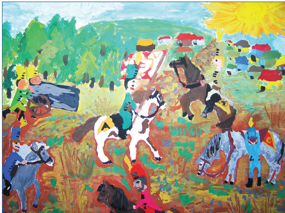
Mayer K. Ella (Unitárius kollégium, 5. B)