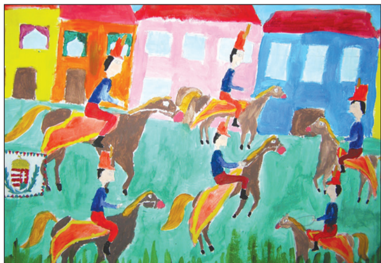
Lucaciu Sára (O. Goga Ált. Isk., 5. C)