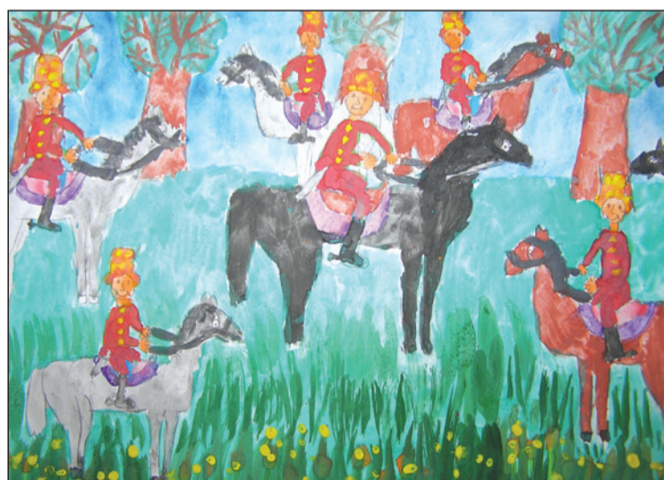
Kovács Renáta (Brassai-líceum, 5. A)