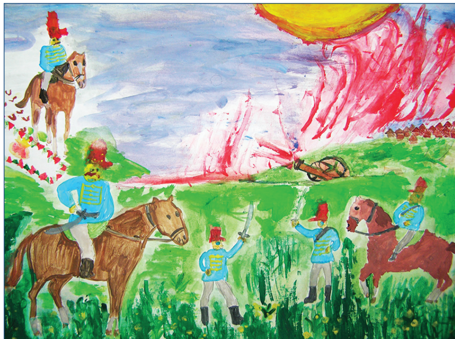
Szabó Péter (Unitárius kollégium, 6. A)