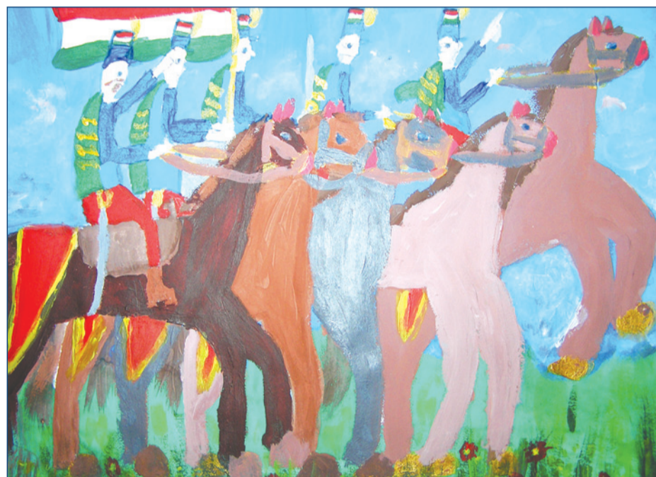
Halmágyi Borbála (Unitárius kollégium, 5. A)