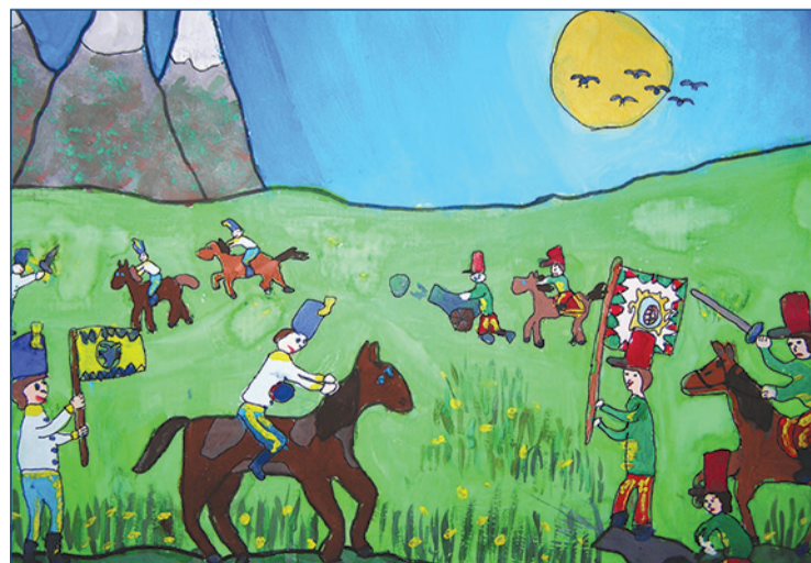
Tánczos Dorottya (Unitárius kollégium, 6. B)