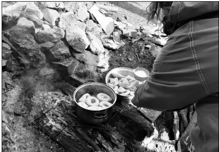
Pánkósítás a Cérna-forrásnál

A következő napokban valóban melegebb lett az idő, a szerdai túrán a Rejtett-forrásnál már csak itt-ott láttunk kis hófoltokat és a tisztásra kellemesen besütött a nap. A hét végéig maradt az enyhe idő, de vasárnapra havas esőt jósoltak a meteorológusok, amiből végül szabályos havazás lett. Így január utolsó vasárnapján friss hóban vágunk neki a Gruia negyedből a Török-vágásnak és a Hója-gerincnek. A legendák szerint a Török-vágás az 1660-as években keletkezett. A hagyomány szerint a várost ostromló törökök vágják, hogy eltereljék a Kis-Szamos vizét a város alól és a kiszáradt árkokon keresztül megkönnyítsék a bejutást