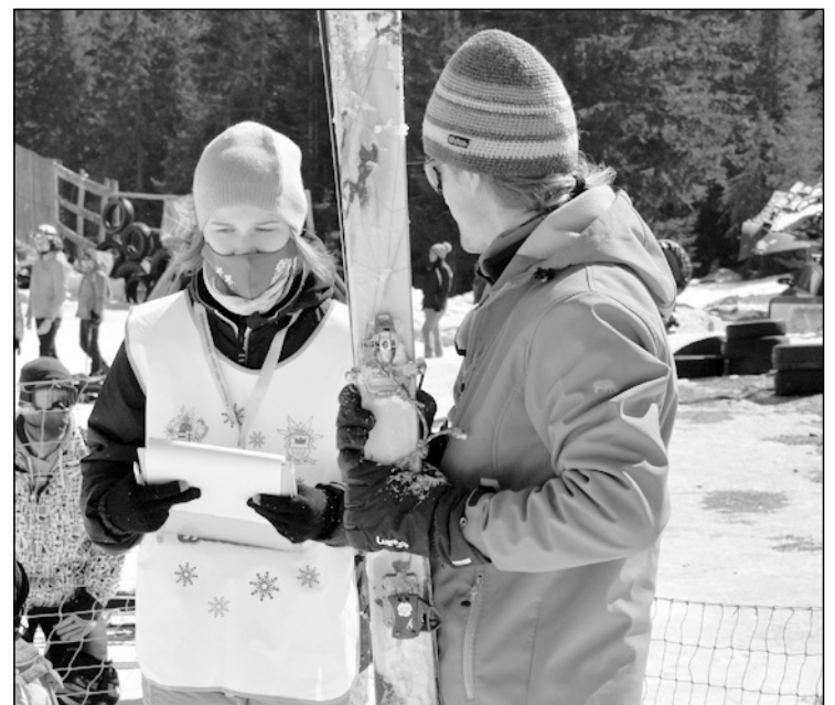
Orsi segít a célnál

B. O.: Szerintem a szervezés igazán profira sikeredett, kisebb konfliktusoktól eltekintve. Ahhoz képest, hogy a koronavírus mennyire korlátozta a lehetőségeket, szerintem a versenyzők szempontjából is jó élmény lehetett ez a két nap. A pozitívumok listájára írható, hogy minden időben elkészült és az embereknek nem kellett várniuk például a díjkiosztóra (bezzeg az én időmben...).