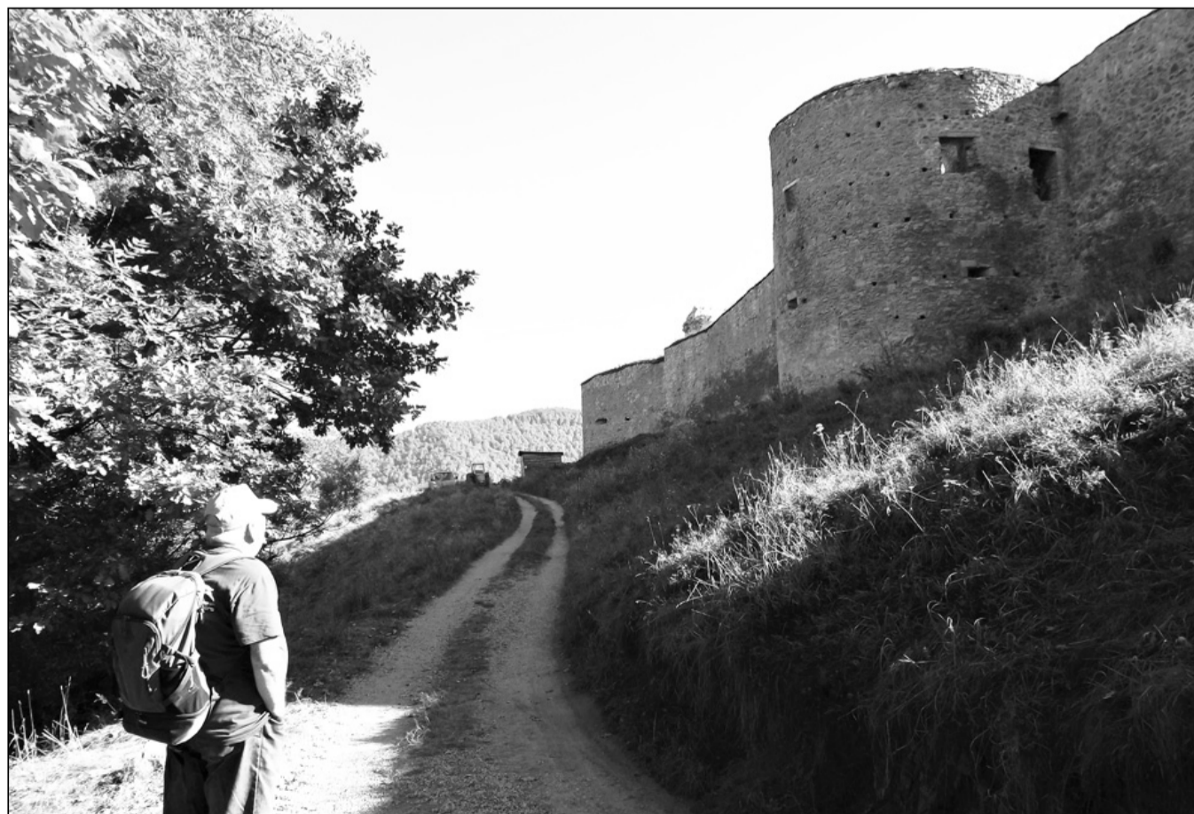
Még idén elkészül a romokból felújított Kalotaszeg vára (Sebesvár)