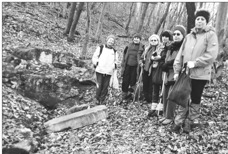
Az évszázados EKE-forrásnál

Az EKE-forrástól az erdőn keresztül a Gorbó-patak völgyébe ereszkedünk le. Igyekeznünk kell, mert hamar sötétedik, jó, ha még világosan elérjük a negyedbe. Fél négyre érünk a monostori végállomásra a 21 km lejárása után.