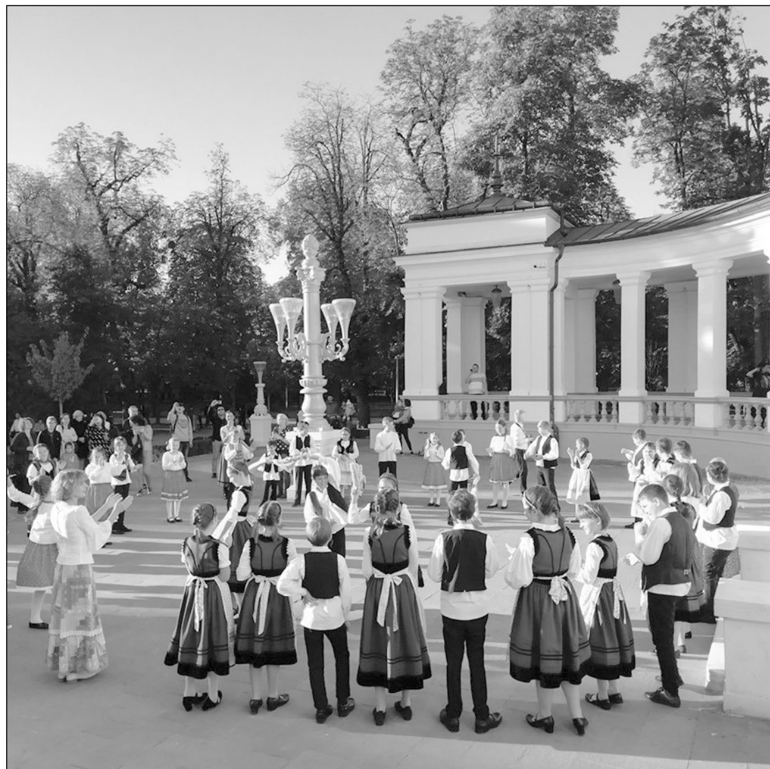
Az unitárius kollégisták fogadták a bálzókat

A ritmus érzete legarchaikusabb élményeink egyike, a magzati állapotban az édesanya csípőjének a ringása az ember első és meghatározó élményei közé tartozik. Csecsemőkorból a kisbaba megnyugszik, ha ringatják és ringatót énekelnek neki, mert így újból átélheti legbiztonságosabb állapotát. Későbbi életéveinkben a tánc veszi át ezt a funkciót, egyszerre van benne a ritmus, a dallam és a mozgás, így a táncban a tér és az idő összekapcsolódik. Sajátos módosult tudatállapotot élünk át tánc közben, nem véletlen, hogy a régi népek szokásaiban vallásos tartalmat hordozott. Az EKE tagjai nemcsak lelkes kirándulók, hanem lelkes táncolók is, nem kell sokat várni, mihelyt megindul a tánczene, korosztálytól függetlenül azonnal felállnak táncolni, így pillanatok alatt önfeledt hangulat alakul ki azok számára is, akik táncolnak és akik nézik őket.