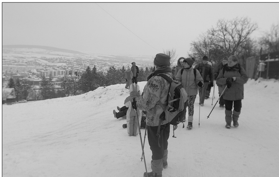
A Hója-gerinc havas ösvényein

A Hajtás-völgyben épülő tömbházak és a szászfenesi bekötőt út miatt a Donát út felső részén a forgalom megnőtt. A keskeny út szélén a gyalogosnak már hely sem maradt, járda pedig egyáltalán nincs, ezért a kényelmesebb és biztonságosabb megoldást választva, a Kányafő út felső vége felé vettük az irányt, és ezen ereszkedtünk le a Donát negyedbe.