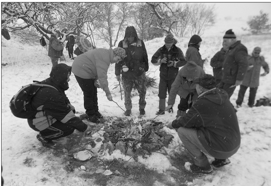
Szalonnasütés a Bácsi-torok tisztásán

December utolsó szombatján ismét egy téli túrával búcsúztunk az óévtől. Előző dél-