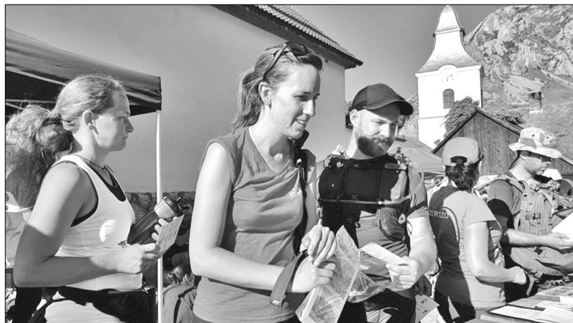
455 túrázó vett részt idén a Jókain

Legközelebb júliusban, majd augusztusban is lesznek hasonló túrák: július 7-én a Vasvári Pál Emlék- és Teljesítménytúra kerékpárosoknak, majd augusztus 18-án a Kós Károly Emlék- és Teljesítménytúrák gyalogosoknak és kerékpárosoknak egyaránt.