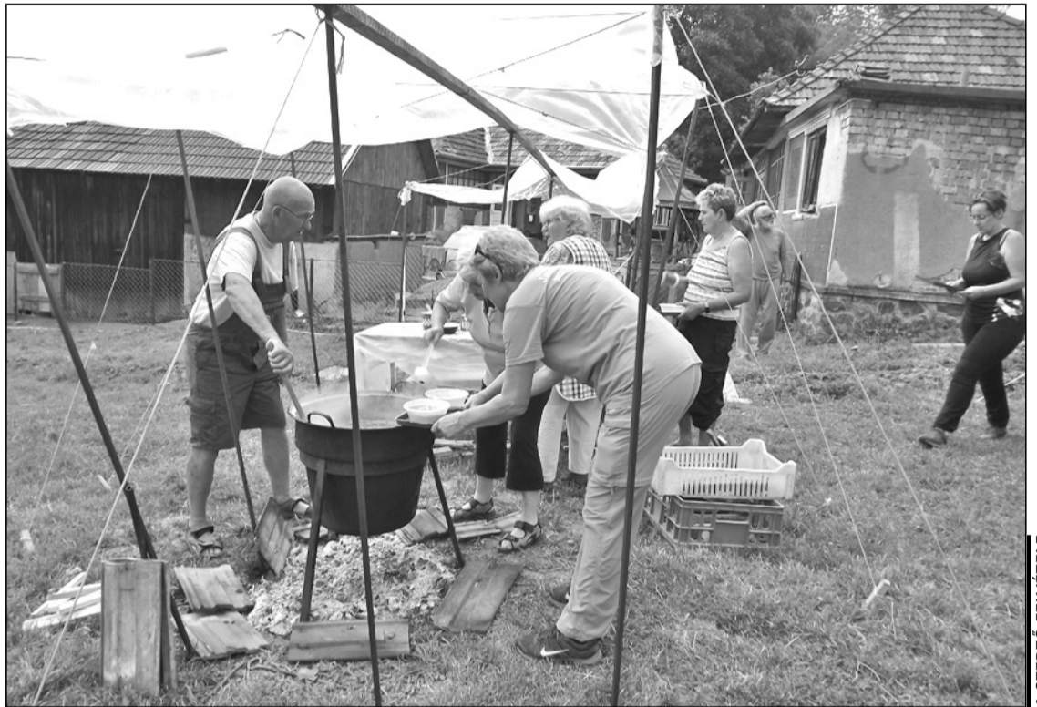
Kirándulással, főzéssel, árokásával, házfestéssel ünnepeltek az ekések