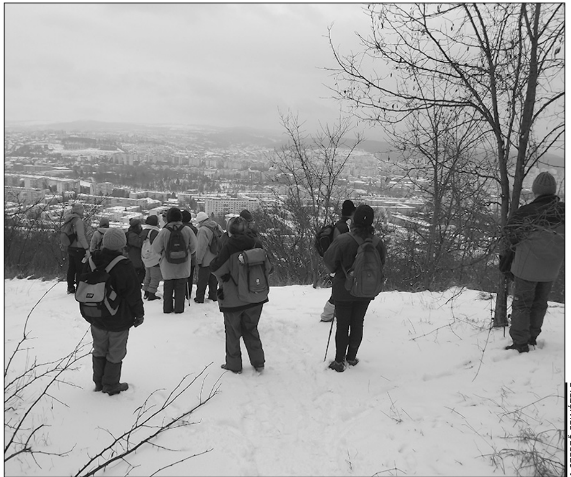
Az egykor népszerű Hójából néhol ma is rálátni a városra