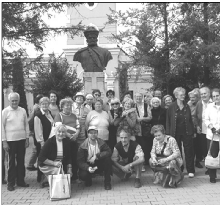
Nyárádszereda; Bocskay és az EKE-sek csoportja

Ezen a kiránduláson csak ízelítőt kaptunk a Nyárád mente érdekességeiből, igyekszünk mielőbb újra erre járni.