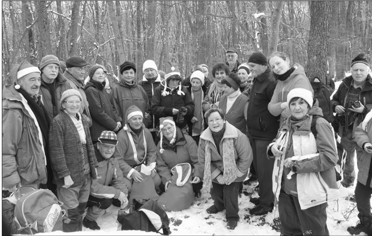
Mikuláskor mindig kimennek a hatszöglet kerek asztalhoz...