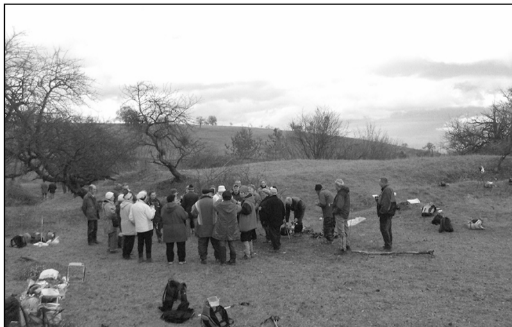
Borforralás a Bácsi-torokban

Ennyit röviden néhány év végi túráról, a meghirdetett programban sokkal több rendezvény szerepelt, és reméljük, hogy még több lesz az új évben. Kellemes ünnepeket és boldog új esztendőt kívánunk minden olvasónknak, és minden érdeklődőt szeretettel várunk a 2018-as rendezvényeinkre!