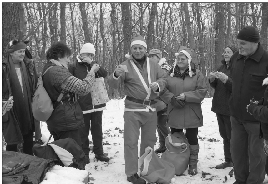
Senki sem tudja, kitől kap ajándékot