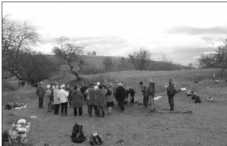
Borforralás a Bácsi-torokban

Ennyit röviden néhány év végi túráról, a meghirdetett programban sokkal több rendezvény szerepelt, és reméljük, hogy még több lesz az új évben. Kellemes ünnepeket és boldog új esztendőt kívánunk minden olvasónknak, és minden érdeklődőt szeretettel várunk a 2018-as rendezvényeinkre!