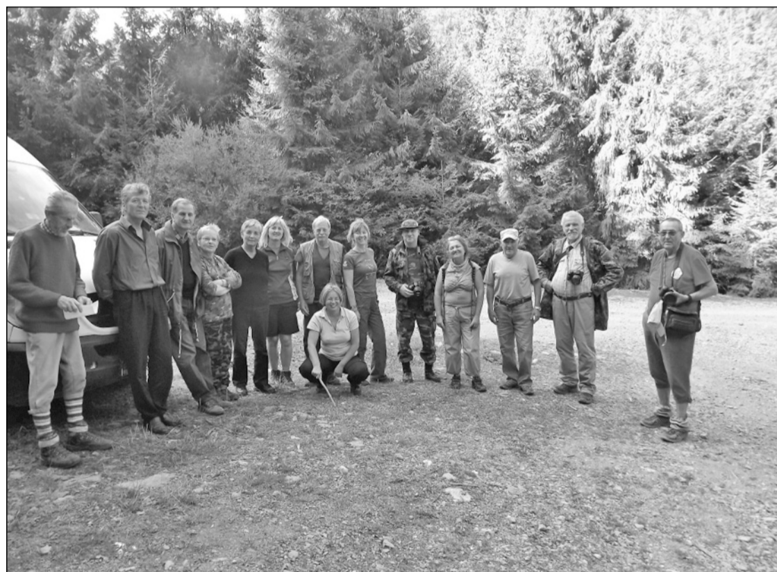
A Sebes-Körös völgyében

A barlangban van villanyvilágítás, de jó, ha van nálunk elemlámpa, így a sötétben ha-