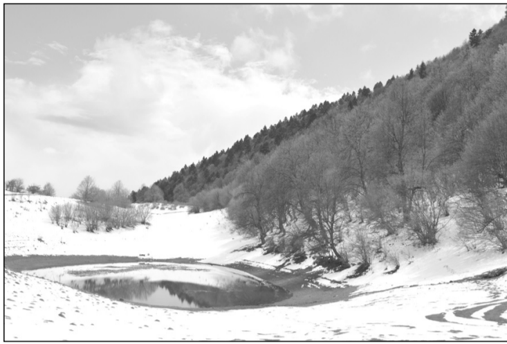
Csillogó tó a hegy alján

De hadd ne csak ilyen légi es dolgokról fecsegek. Inkább ajánljam figyelmükbe ezt a csodálatos, könnyen megközelíthető, a túrázás, kirándulás szempontjából gondozott és tiszta