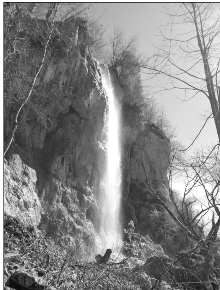
Vízesés a Fehér-Körösön

lettünk. Joldișești településig szerettünk volna eljutni kocsival, de az erdészeti út itt már nagyon rossz állapotban volt, így kocsink leparkolt és gyalog indultunk tovább, a helybeliek által mutatott úton Hoancă és Băi hegyi települések elszórt házai közt értünk fel egy víznyelőkhöz (dolinákkal) teli tetőre Fehér és Hunyad megye határán. Embereket nemigen láttunk, az itt lévő házakat lehet csak nyáron lakják, mikor állatokat legeltetnek. Kis tempóval is fehérlétt egy dombon, valamikor iskola is működött ott, ahogy mondták, akkoriban többen laktak ezen a vidéken. Útközben sok volt a lila krókusz (sáfrány) és a fehér hóvirág, virágzott a farkasboroszlán, itt-ott hófoltokat is láttunk. A krókusz az első igazi jele a tavasz beköszöntésének. Az első meleg, tél végi, kora tavaszi napsugarak hatására előbújnak a talajból a csésze alakú, mélylila vagy kétszínű, csikos virágok. Egy bekerített udvaron valóságos lila szőnyeget alkotottak. A sáfrány egyedülálló, különlegesen erős és hatékony fűszer. A mi kárpáti sáfrányunkban ugyan kevés a hatóanyag (lehet ez menti a kipusztulástól), de egy természetesen fűszert tartalmazó szarított bibéje keresett kereskedelmi cikk, ára vetekszik az aranyéval. A legkülönbözőbb ételek, sütemények ízesítésére és színezésére, sőt szépítkezésre is használják. A világ legdrágább fűszere, mert 1 kg-nyi szá-