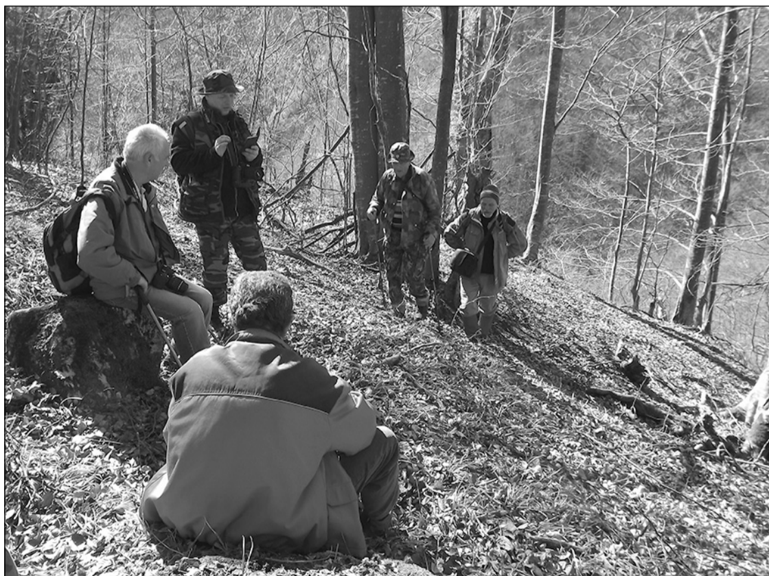
Pihenő a vízesés fölött

A vízesést rejtettsége és a táj vadsága teszi különlegessé. A Fehér-Körös forrása és a Fehér-Körös vízesése (Pișoia Crișului) az Erdélyi-érchegység egyik vad völgyének oldalában található, megközelítése elég körülményes, a helyet kevesen ismerik és így kevesen látogatják, túrakalauzokban sem találtunk róla leírást, az interneten is keveset. A kirándulók inkább a könnyebben megközelíthető alsóvidrai Pișoia vízesést keresik fel. Visszafelé kimásztuk a meredek oldalt és a leírt úton jutottunk vissza a mikrobuszhoz, a megtett gyalogtúra 12 km volt 600 méter szintkülönbséggel. Hazafelé jövet még megálltunk Szolcsva mellett a Sipote vízesésnél és megcsodáltuk a Bedellő sziklát a lemenő nap fényében.