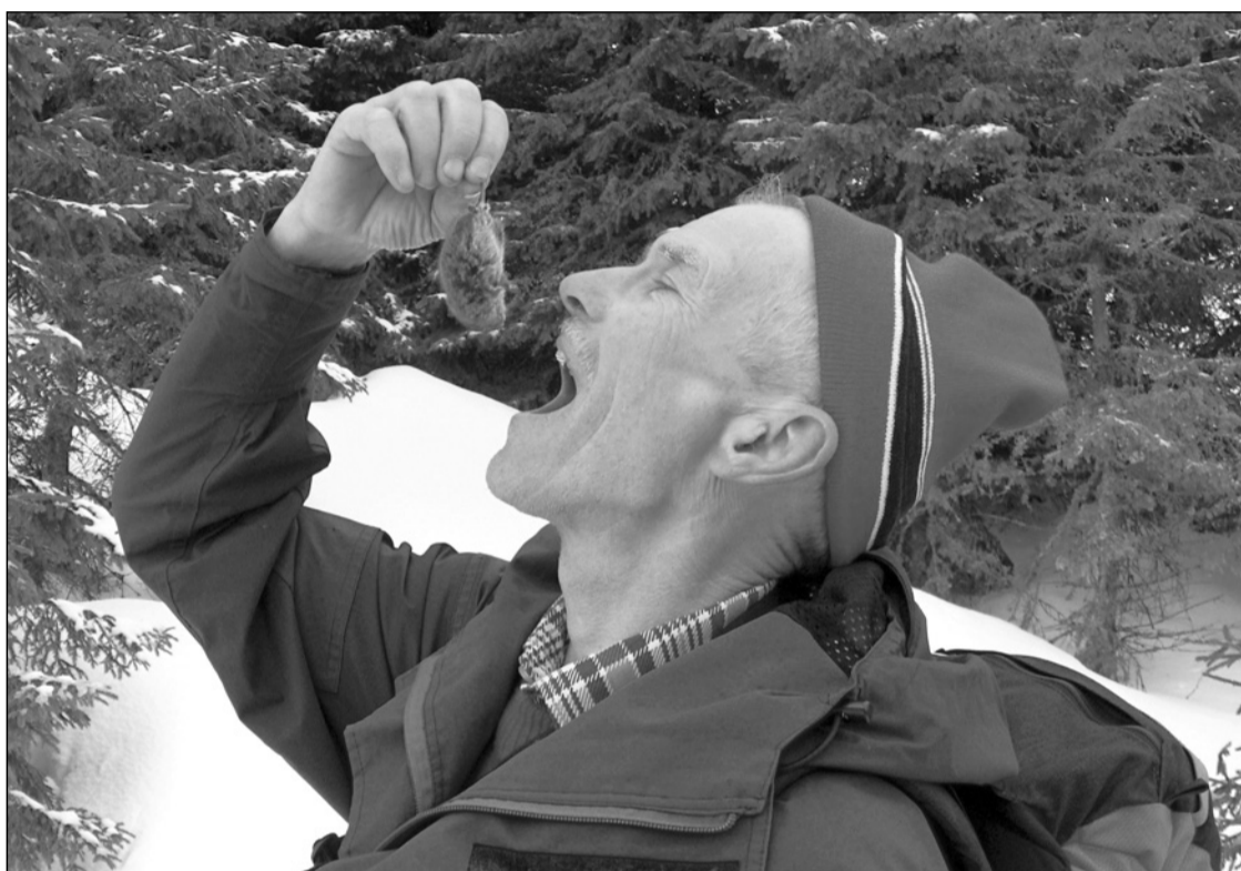
Ki az egeret szereti, rossz ember nem lehet – csak eltévedt „ekés”

Epilógus: Mint később kiderült, az előszilveszterező társaságból nem csak ő járt így, hanem még hárman, ki később, ki korábban, de már az újévben ébredtek fel, hozzátartozóik nem kis bosszúsággal lekésve a szilveszteri bulit.