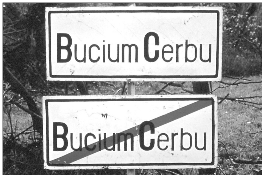
Be se tehatték a lábukat az EKE-sek a világ legkisebb településére