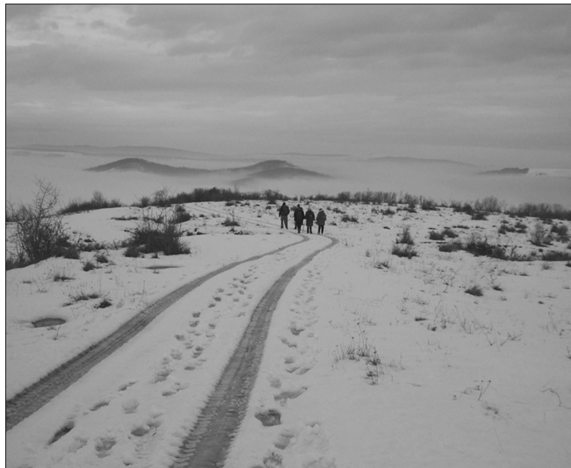
Télen-nyáron egyre kedveltebb kirándulólhelyünk a szászfenesi erdő