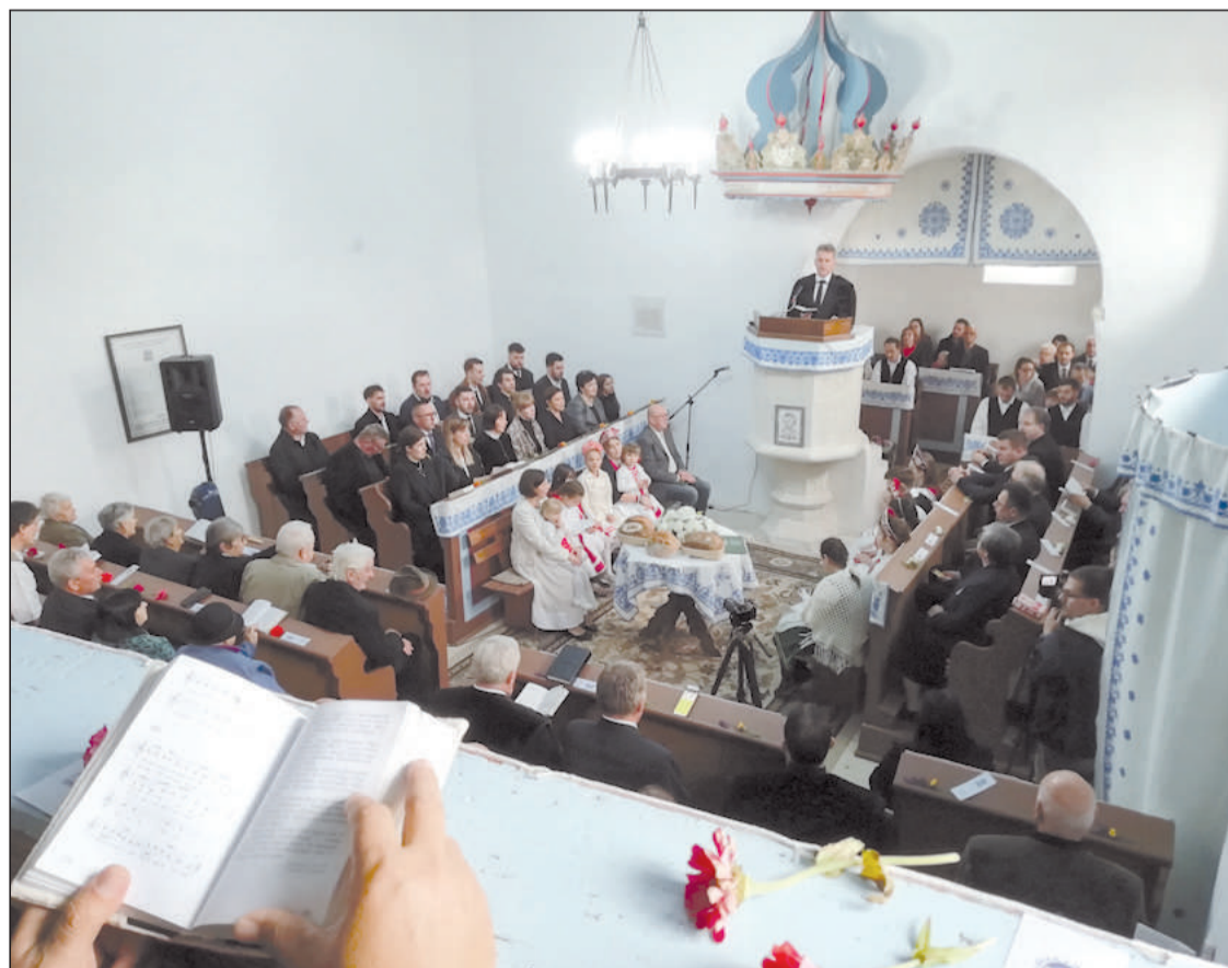
A kidei reformátusság csupán 150 lelket számlál, de egyre több fiatal család vásárol itt házat