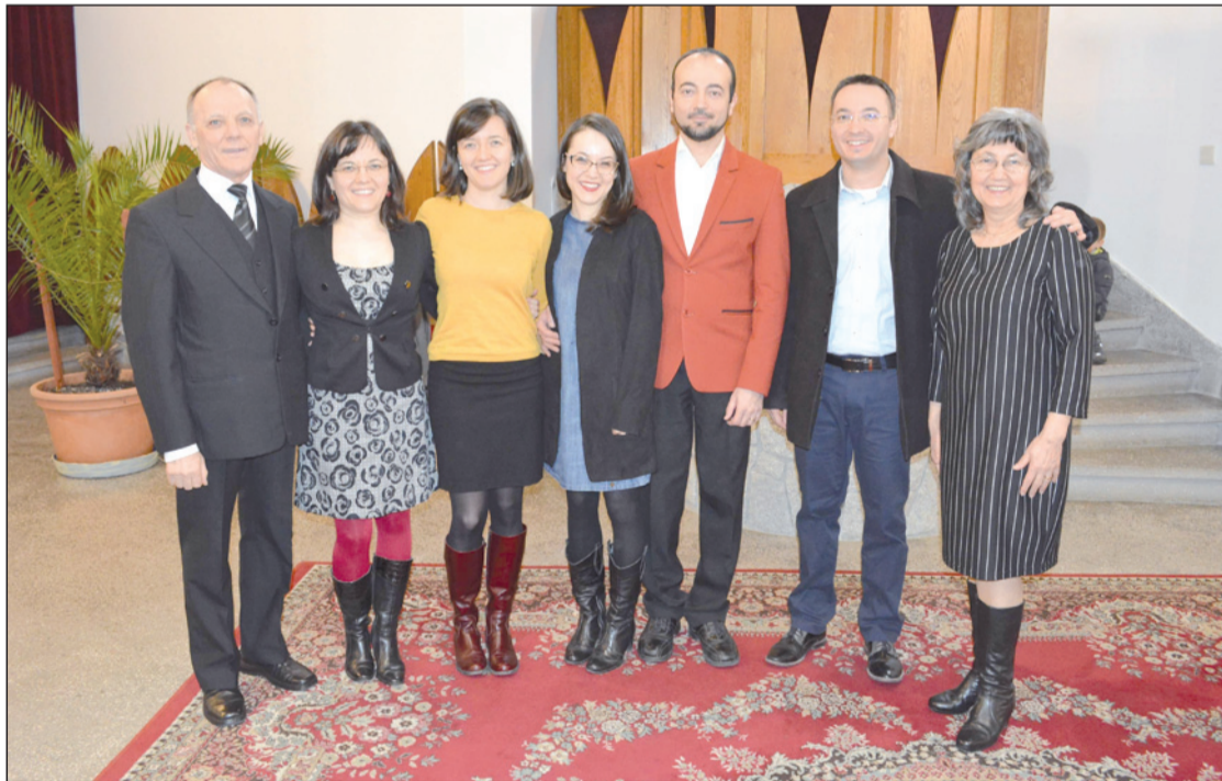
Szerettem a nagy család hangulatát, a testvérek közötti szeretetet, ez volt számomra a minta