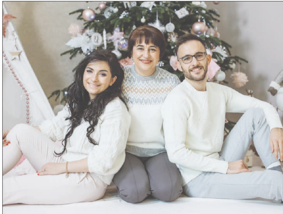
A fiatalok tele vannak értékekkel, segíteni kell nekik, hogy ezt felszabadítsák!