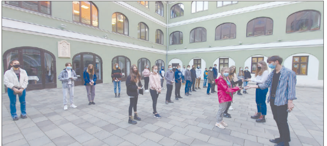
Több mint 200 Biblia talált diákgazdára

Nekünk most az a feladatunk, hogy átadjuk nektek a Bibliákat, de jogos a kérdés, hogy miért adjuk át őket. Minden, ami már régebb óta a szokásvilágunkban él, az szinte közhelyé válik. A Biblia-átadás is ilyen tevékenység lenne, ha nem vigyáznánk rá. Mindenki ismeri, nagy hagyománya van, mindenki áhíttal tekint rá, de félő, hogy igazán mély mondanivalója elhalványul.