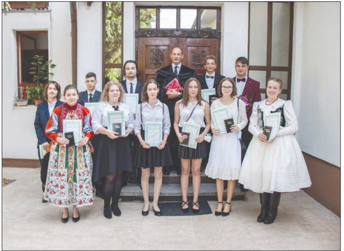
Másképpen vették az első úrvacsorát a konfirmálók