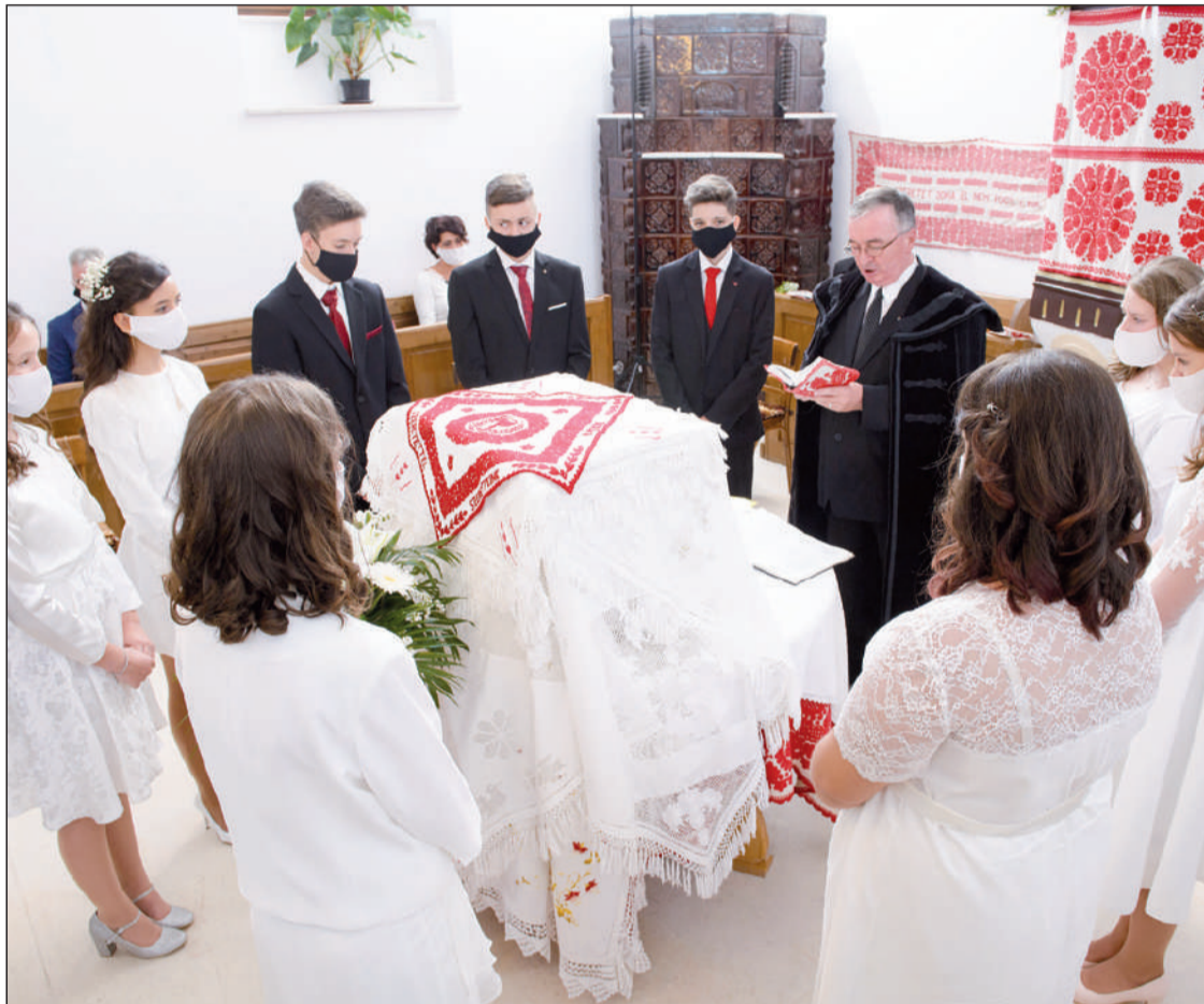
Óvintézkedésekkel konfirmáltak a kolozsvári egyházközségekben

A 2020-as esztendő alaposan próbára tette a változásokhoz, az ismeretlenhez való gyors alkalmazkodóképességünket. Nem volt forgatókönyvünk a korábban csak filmvászorról, könyvekből ismert világjárványra, ez egyszerre rótt nagy felelősséget és adott valamelyest szabad kezét a kisközösségeknek: minden csoport maga volt kénytelen megalkotni új szabályait. Nincs ez másképpen az egyházban sem, a tavaszra tervezett konfirmációi ünnepségeket olykor alig két héttel az esemény előtt le kellett mondani. Késő tavaszra már egyértelművé vált, hogy az életnek valahogyan folytatódnia kell, így a Kolozsvári Református Egyházkerület egyházközségei rendre kitértek az idej generáció konfirmálásának új időpontját. A reformáció napjával bezárólag három kivétellel mindenhol lezajlott a konfirmáció, a megfelelő óvintézkedésekkel. Bár aligha akad, aki hagyományt szeretne teremteni a maszkos ünneplésből, a különálló kelyhek használata úrvacsoravételkor és az internetes közvetítés lehetősége helyenként akár szokássá is válhat. (Részletek a 7. oldalon)