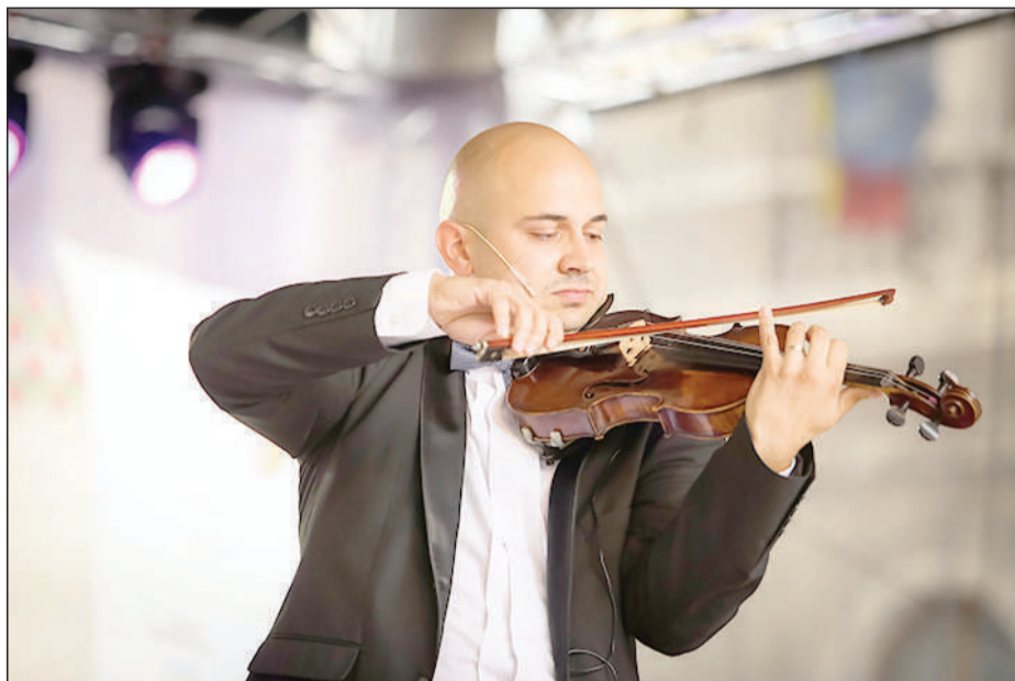
Hegedűsként második családjával, az Operettissimóval tudott kibontakozni

– A kántori pályafutásom elején felvállaltam az ifjúsággal való foglalko-