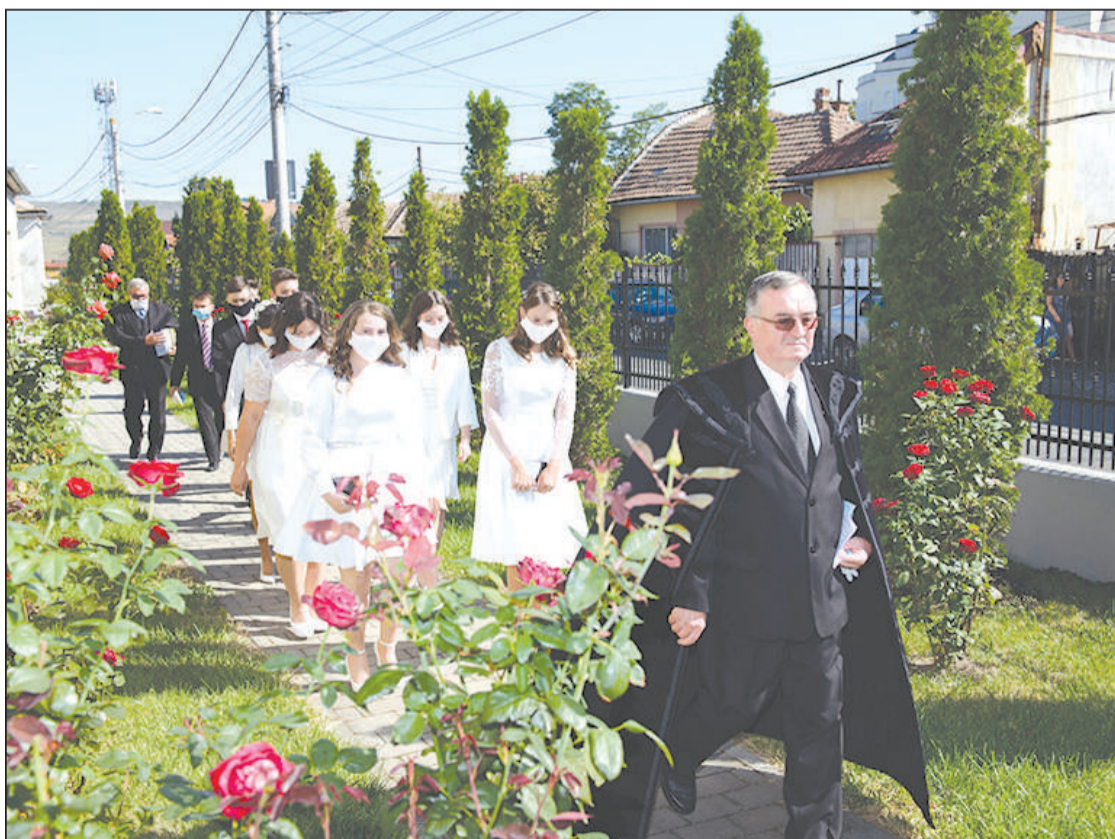
Szamosfalván kilencen konfirmáltak az idén