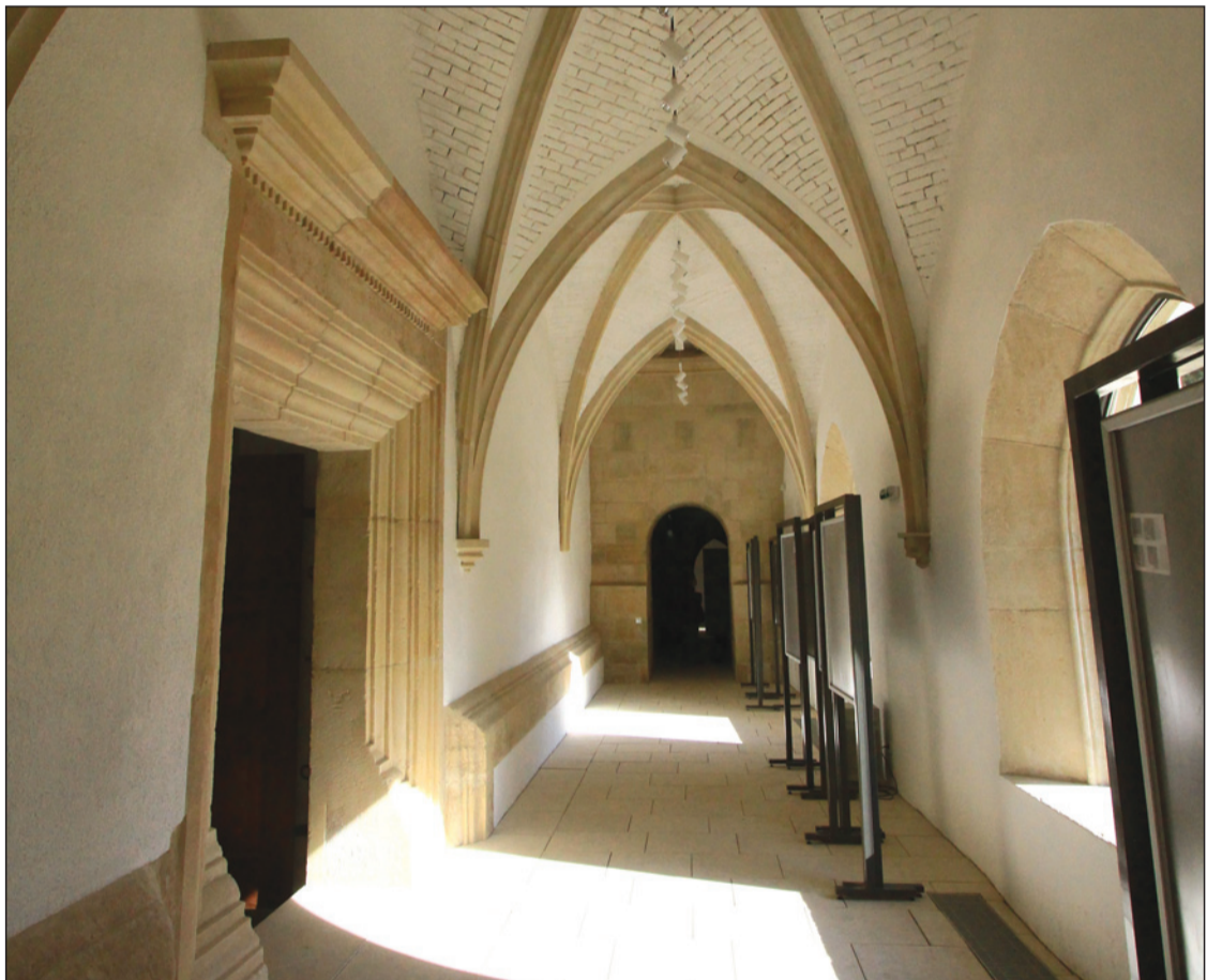
Megnyitották az egykori kerengőt is