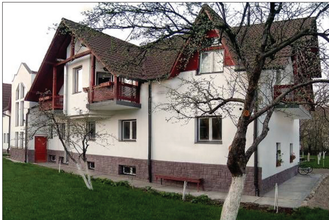
Nyolc szobája van a holland támogatással épült aggmenháznak

– Lehet és kell is kapcsolódnunk hozzájuk, hiszen magunkra veszünk valaki terhét, amikor befogadjuk. Nagyon nehéz az az időszak, amikor szellemileg kezdenek leépülni. Volt egy néni, aki már alig tudott beszélni, megkezdte a mondatot értelmesen, de a folytatása már teljes halandzsza volt. És ilyenkor a mozdulataiból, a mosolyából, az összevont szemöldökéből kellett kitárolni, hogy éppen mit szeretne elmondani. Ezek nehezebb időszakok, de mindenkit el kell kísérni az utolsó lépcsőfokig. Mindig megviseli az embert a halál ténye, hiszen soha nem könnyű végigszenvedni valakivel az utolsó pillanatokat, de ezt az a reménységgel tesszük, hogy nem a halál az utolsó szó, hanem átmenetként tekintünk rá egy másik életbe.