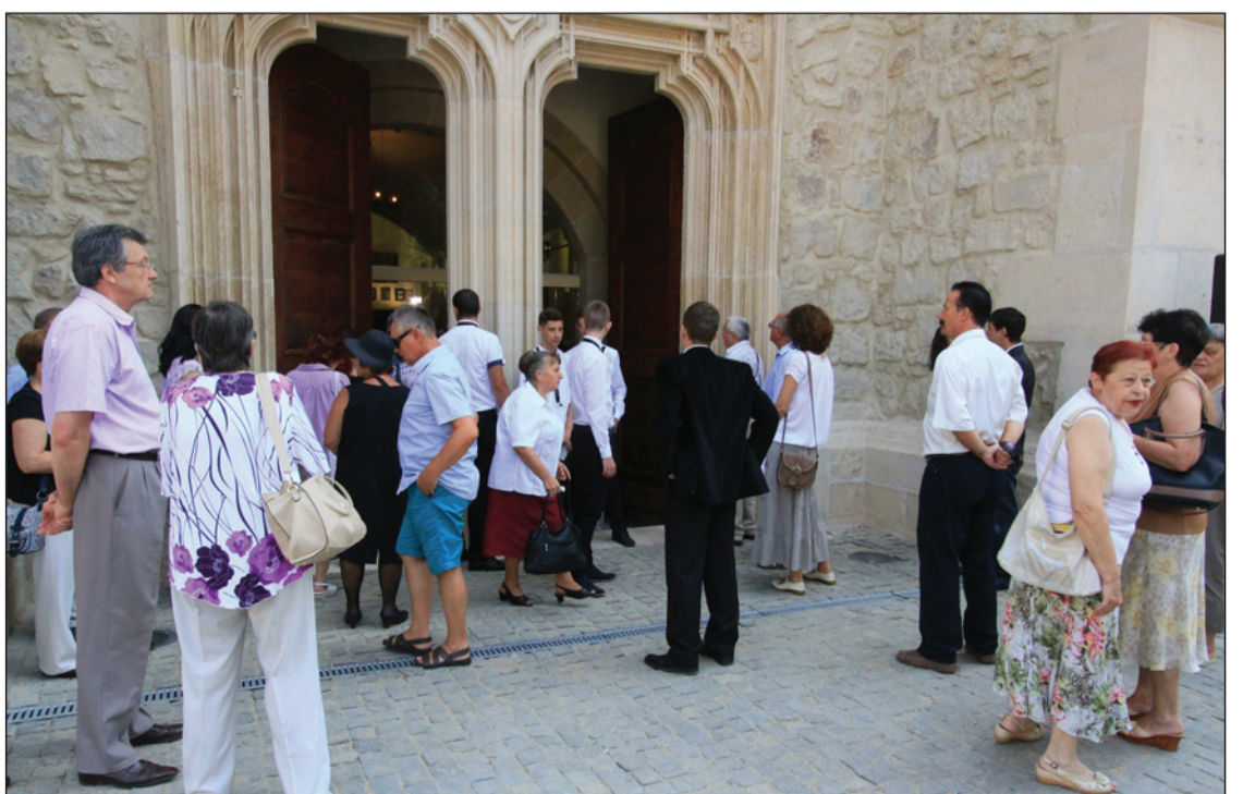
Megnyitása utáni héten legalább kétezeren látogatták meg a templomot