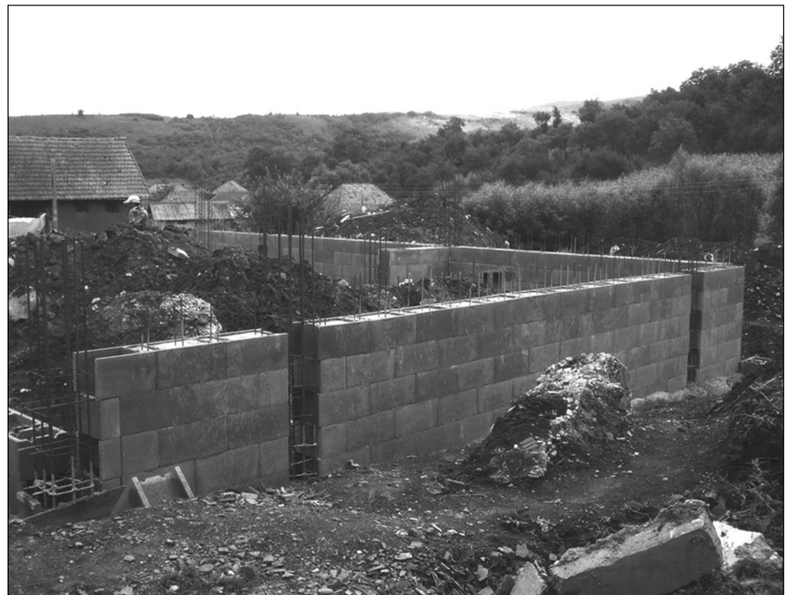
Könyvtár vagy számítógépterem, illetve múzeum is lesz a magyarpalatkai gyülekezeti házból

– Jelenleg az építkezési engedélyt készülünk újra kérvényezni a felújított tervekre. Ennek menete többek között azért is bizonyult időigényesnek, mert a rendelkezésre álló telket egyetlen topográfiai és kataszteri szám alatt kell egységesíteni – jelezte az ügyintézés elhúzódságának folyamatairól a lelkész. – Nyilvánvaló, hogy az 1,7 millió eurós befektetést igénylő projekthez szükséges pénzalapot az egyházközségnek nem áll módjában saját forrásból biztosítani, ezért egy nyertes európai uniós pályázatból származó támogatásban bízunk. Tudomásunk szerint jövő év elején jelennek meg a 2014–2020-as időszakra vonatkozó pályázati kiírások, amelyeket figyelniünk kell, bár egyelőre úgy tűnik, hogy az EU-s politika inkább a napközi, avagy kisebb, családi jellegű otthonok kialakításának kedvez a lehetséges támogatások szempontjából – jegyezte meg a lelkész, aki szerint eddig közel 200 ezer eurót fordítottak a telkek megvásárlására, a tervek elkészítésére és az L alakú épület alapjának és alagsorának megöntésére.