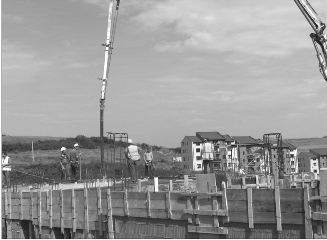
Passzívház Szászfenesen: templom, tanácsterem, parókia, vendégszobák

Templom, múzeum, öregotthon, közösségi ház épül