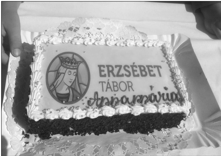
Sosem volt ekkora születésnap!