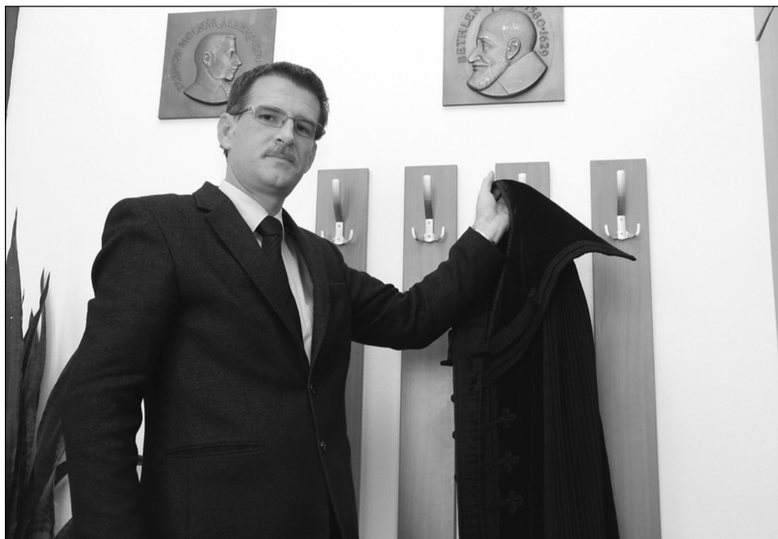
Nehéz döntés időnként szögre akasztani a palástot a számok kedvéért

a fizetés természetben történt, mint gabona, kaszáló), természetesen ezen érték után nem fizettek társadalombiztosítási járulékot, de amennyiben az egyházkerületek igazolták szolgálatukat, hűségük és munkájuk elismerésül állandó havi segélyben részesülnek. A nyugdíj-kiegészítésben azok részesülnek, akik külföldre költöztek, és ott folytatták szolgálatukat. Legtöbb esetben lelkészekről van szó. Az egykori törvények szerint például Magyarországon az állami nyugdíjpénztár a teljes szolgálati időre hagyta jóvá a nyugdíjat, beleszámolva az itthon ledolgozott éveket is. Ennek viszont az volt a feltétele, hogy le kellett mondaniuk az itthoni nyugdíjukról. Ám sok esetben csak szociális nyugdíjat alapítottak meg számukra. Ezért kiszámoltuk a mi rendszerünkben való jogosultság alapján a nyugdíjakat (mennyi járna az itthoni szolgálati évektől), összevetettük a forintban kapott összeggel, és a külföldi nyugdíjukat kiegészítettük a különbözet értékével. Ezt is havonta folyósítjuk. Hűségpótlékok adunk a nem lelkesítői jellegű tagoknak, a ledolgozott évek számának függvényében. Minden egyházon belül ledolgozott 5 évre havonta 10 lej hűségpótlék jár a