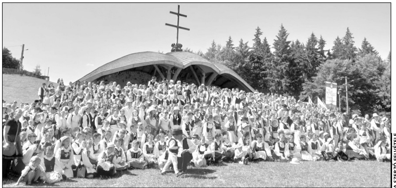
Felejthetetlen közösségi élmény a csíksomlyói nyeregben az Ezer Székely Leány Napján

Kirándulásunk második napját teljes egészében az Ezer Székely Leány Napjára áldoztuk. Az ünnepség Csíkszereda központjában kezdődött a székely leányok és legények bemutatkozásával, onnan a csíksomlyói nyeregbe vonultunk véget nem érő sorokban, elől a huszárok, majd a székely falvak leányai, legényei népviseletbe öltözve, díszes lovas fogatokon, utánuk pedig hosszú-hosszú sorokban a résztvevők. A nyeregben szentmisével kezdődött az ünnepség, majd bemutakoztak a részt vevő néptáncosok, ezután a közös éneklés és tánc következett. Kulturális örökségünk ápolásának ez a különösen felemelő és közösségépítő rendezvénye felejthetetlen élménnyel gazdagított bennünket. Jó volt ott lenni! A harmadik napon a Csíki Székely Múzeum két nagyszerű kiállítását, a Nagy István 150 és a Mikó vár története tárlatát néztük meg.