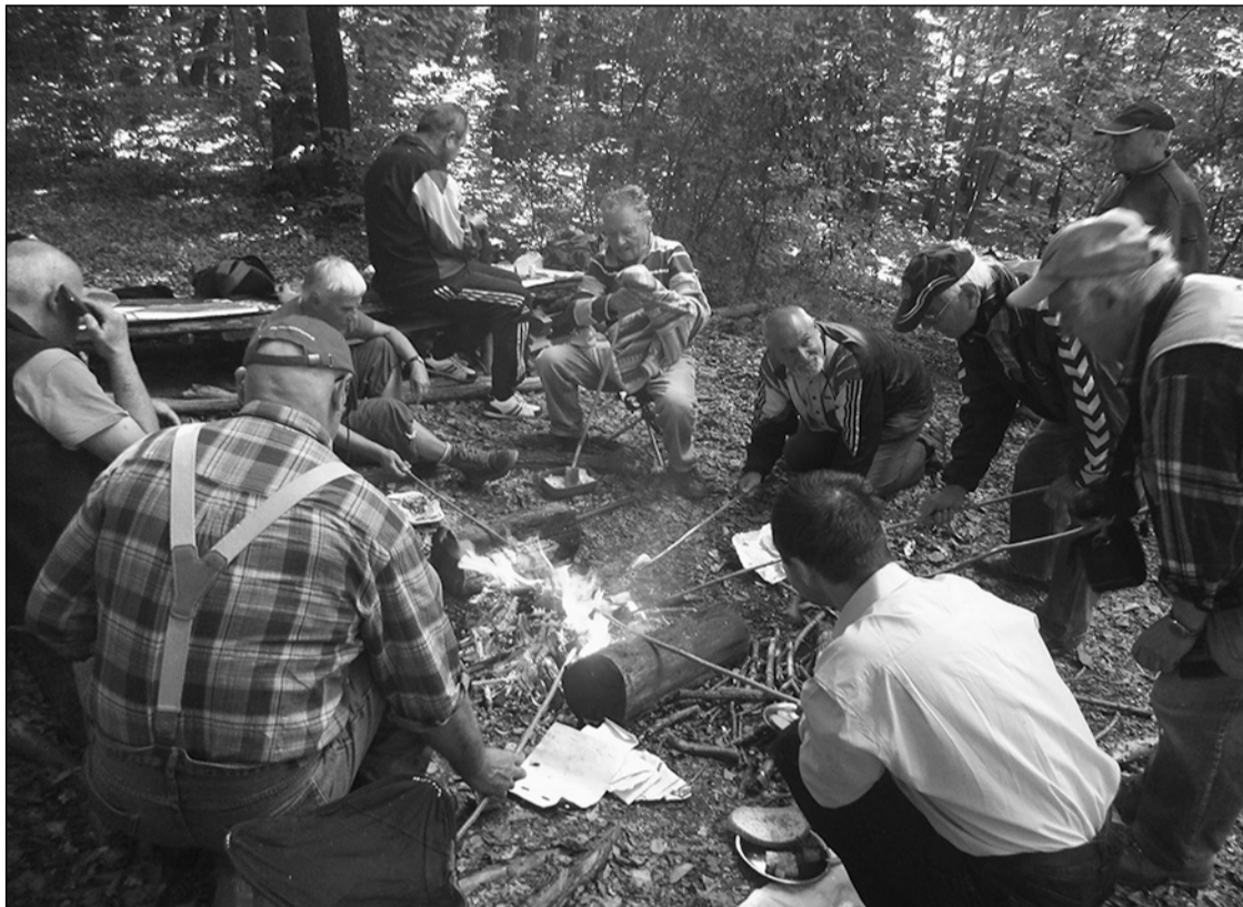
Salonnasütés a Slamovics-háznál

Szeptember 24-én szintén Kolozsvár környékén túráz-