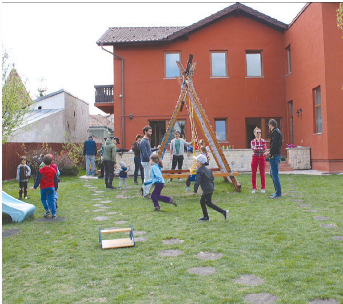
Töközi ovisok a majdani új óvoda udvarán