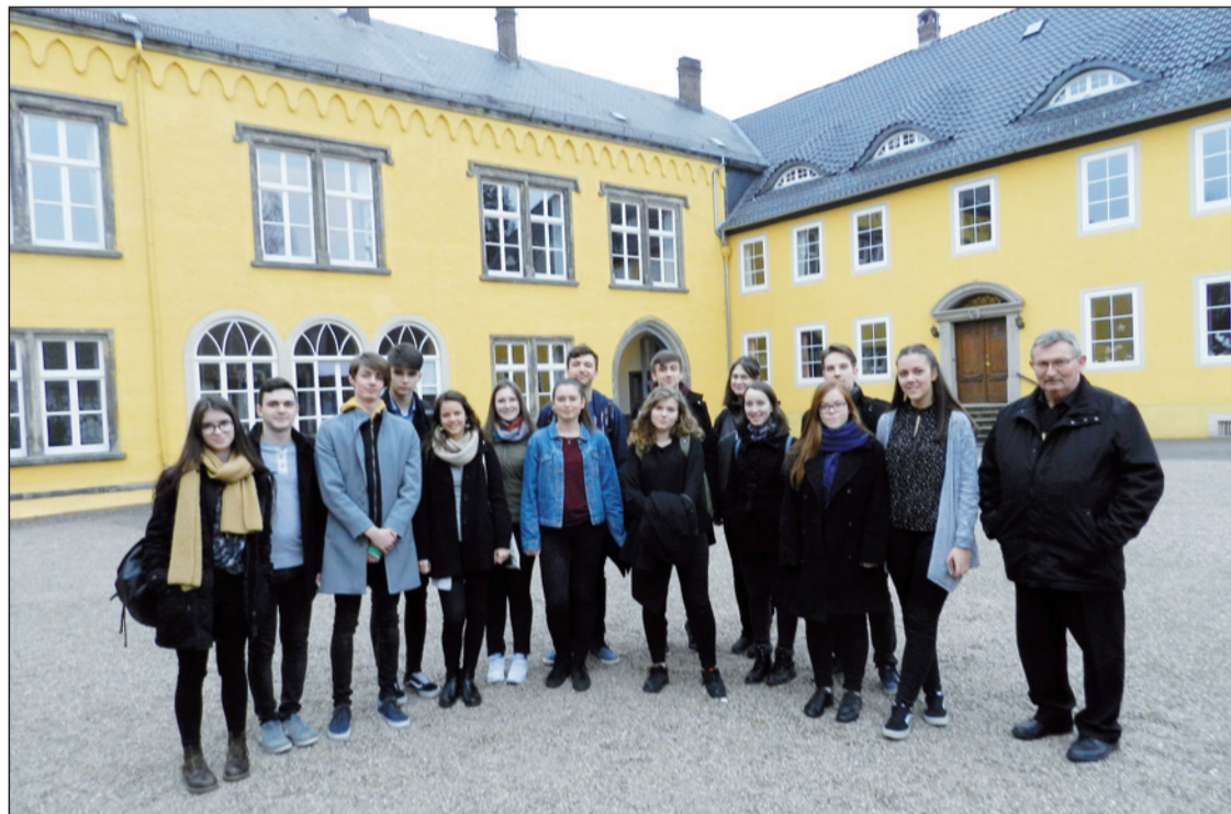
Szegényes némettudásunk is csiszolódott a bárónő unokáinak köszönhetően

„A világ csupa zene” – január óta így hangzott jelszava a Kolozsvári Református Kollégium tizenöt lelkes kórustagjának és Székely Árpád karnagy-igazgató úrnak. Ugyanis iskolánk régi és hűséges támogatója, Sitta von Eckardstein német bárónő március végén ünnepelte születésnapját, s ezen alkalomból meghívta kórusunk egy kis csapatát, hogy műsorunkkal színesítsük a jeles eseményt.