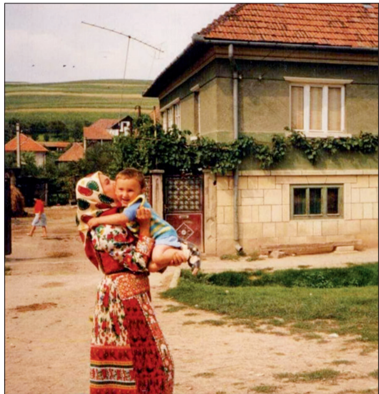
A cifra kalotaszegi Mérában született, templomos református családban

Erdélyi Énekeskönyvünk egyik húsvéti énekével szeretnék minden olvasónak áldott ünnepet kívánni „Nincs a sírban örök enyészet, ember csak új hazát cserél, ami minket itt lent is éltet: a lélek, az örökre él. Mi az égből keblünkre szálla, győzni fog az a sír felett és megmarad Istennek hála a hit, remény és szeretet!”