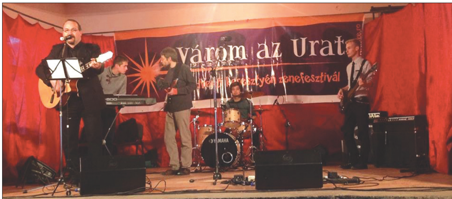
Hatalmas erőt adhat egy-egy rendezvény a kis közösségekben

– Biztos, hogy az ifjúságot rengeteg más minden érdekli, de érdekes az, hogy ezek a fiatalok már nem csak azért gyűlnek össze, mert Várom az Urat van a környéken, hanem azért, mert ezek a rendezvények kezdik összekovácsolni őket, még akkor is, ha lazább értelemben vett közösséggé. Nagyon sokan eljönnek azért, mert érzik, hogy ennek a nagy közösségnek kezdenek részeseivé válni. Ez nagyon fontos – vallja.