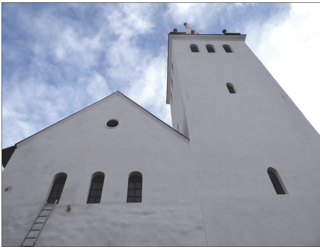
Márciustól újra templomukba járhatnak a székiek