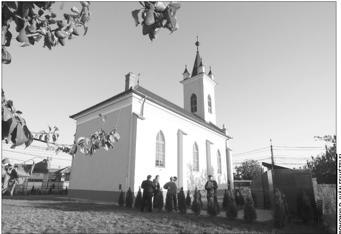
Két év alatt kívül-belül megújult a szamosfalvi református templom

Minden család 500 lejellel járult hozzá a templom helyreállításához, ezen kívül más gyülekezetektől, a püspökségtől, az egyházmegyétől és a román kormánytól is kaptak támogatást. Bekapcsolódott továbbá a helyi ortodox gyülekezet is, amelyek tagjai a reformátusok korábbi segítségét pénzadományokkal hálálták meg. – Jó a viszony a lelkipásztorok és a gyülekezeti tagok között, ez valószínűleg annak köszönhető, hogy amikor a románok hat évvel ezelőtt az ortodox templomot építették, a szamosfalvi reformátusok is melléjük álltak. Most pedig már nem is kellett kérnünk, jöttek maguktól, és elég szép összeggel segítettek – magyarázza Péntek Márton, és hozzátesszi: a templom tornya is komoly restauráláson esett át, kicserélték to-