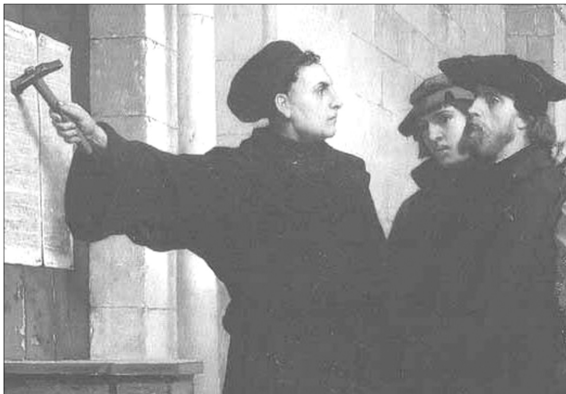
Luther kiszögezi téziseit a wittenbergi vártemplom kapujára (Ferdinand Pauwels, 1872)