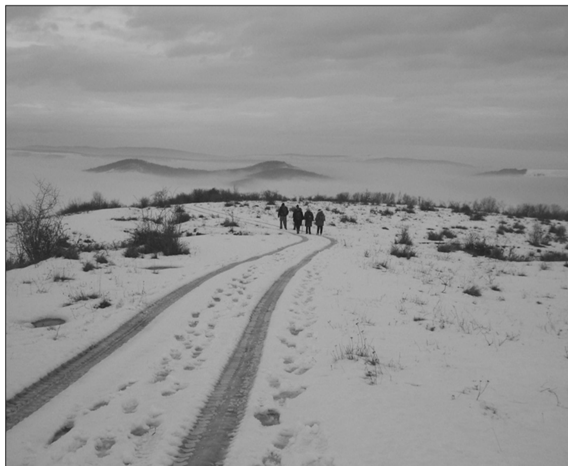
Télen-nyáron egyre kedveltebb kirándulólhelyünk a szászfenesi erdő

Azóta többször bejártuk ezt az erdőt, megismertük keresztben-hosszában, egyik végétől a másikig. Szeretünk erre kirándulni, szép, mikor zöldül tavasszal, májusban virágzik a gyöngyvirág, júniusban nyílik a törperőzsa, a meleg nyári napokon kellemesen hűvösek árnyékos ösvényei, ősszel csodálhatjuk a tarka színeket, télen sétálhatunk havas útjain, tavasztól késő őszig gombászhatunk, és sokszor elszórakozunk ezen a kalandunkon.